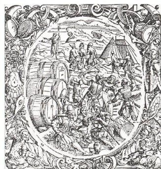
Aus: Paracelsus, Grosse Wundarznei.

Begeben Sie sich in dieser Weiterbildung zu den Spuren von Paracelsus. Sein Wissen und Wirken gilt als umfassend, was die Tatsache betrifft, den Menschen ganzheitlich zu betrachten. Spagyrika sind Arzneimittel, welche auf der Basis von alchemistischen Erkenntnissen hergestellt werden. Ausgangsmaterial sind pflanzliche, mineralische und animalische Stoffe. In diesem Seminar machen Sie sich vertraut mit dem individuellen Rezeptieren von spagyrischen Heilmitteln.