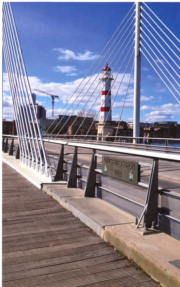
Blick auf Malmö.

Die Präsentationen der Forschungsarbeiten von vier PhD-Studierenden, darunter eine Hebamme, waren eindrucksvoll. Ebenso eindrucksvoll war der Besuch der Gebärabteilung des Skåne Universität Hospitals in Malmö, in der jedes Jahr über 5000 Kinder geboren werden, davon