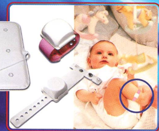
Surveillance · Sécurité