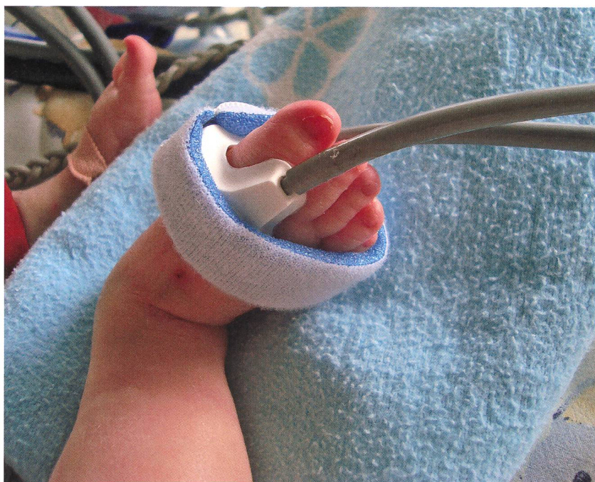
Avec une attache velcro pour assurer un bon maintien.