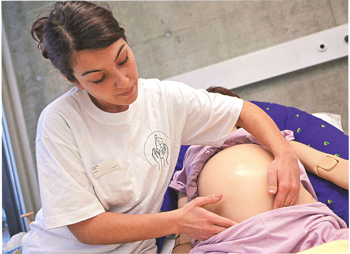
Im Skillsunterricht trainieren die Studierenden an Computer gesteuerten Modellen. Den Unterricht planen und erteilen Dozierende der Fachhochschule gemeinsam mit Fachpersonen aus der Praxis.

kumsplatzbewirtschaftung sowie der Ausbildung von Praxisausbilderinnen. Für den Skillsunterricht entwickelten BFH und ZHAW gemeinsam das erste deutschsprachige Lehrmittel, das heute vor der Drucklegung steht und in der deutschsprachigen Fachliteratur einzigartig sein wird.