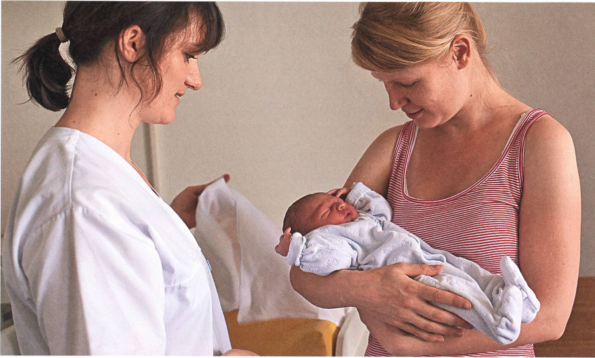
Hebammenstudierende wenden im Praktikum an, was sie im Skillsunterricht geübt haben – einfühlsam auf die Frauen eingehen, situationsadäquat entscheiden und vernetzt handeln.