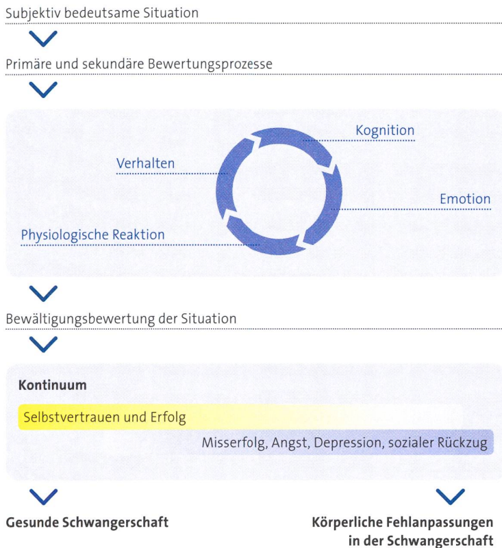
Abbildung 1 Stressverarbeitung während der Schwangerschaft, gemäss [2]

zwei hauptsächliche Thesen postuliert worden: die fetale Mangelernährung und die erhöhte fetale Glucocorticoidexposition . Neugeborene, die ein Geburtsgewicht aufweisen, das unterhalb des fünften Perzentils der geschlechtsspezifischen Referenzwerte liegt, zeigen eine zu schwache physiologische Aktivierung der Hypothalamus-Hypophysen-Nebennieren-Achse (HHNA) auf einen induzierten Stress (Fersenstich) [7]. Intrauterine Veränderungen der HHNA scheinen demnach bis in die postnatale Periode erhalten zu bleiben [7]. In einer Untersuchung konnte sogar noch bei 10-jährigen Kindern, deren Mütter in der Schwangerschaft Glucocorticoide verabreicht wurden, eine veränderte Reaktivität der HHNA nachgewiesen werden [8]. Kinder von Müttern, denen während der Schwangerschaft aufgrund einer drohenden Frühgeburt, Glucocorticoide zur Lungenreifung verabreicht wurden, zeigen auf eine Stressinduktion geringere Kontrollerwartungen, höhere Stressbewertungen und höhere Cortisolanstiege im Vergleich zu Kindern ohne Glucocorticoidverabreichung während der Schwangerschaft [8]. Nicht nur die fetale HHNA kann durch Auswirkungen des Stresshormones Cortisol schon vor der Geburt beeinflusst werden und langandauernde Veränderungen nach sich ziehen [7,8], auch bei den Müttern können Vorhersagen über den Gesundheitsverlauf nach der Schwangerschaft anhand von psychophysiologischen Stressmarkern abgeleitet werden.