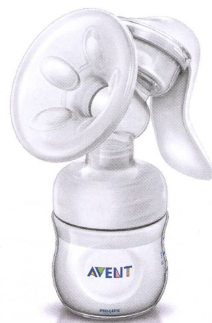
Tire-lait manuel Natural