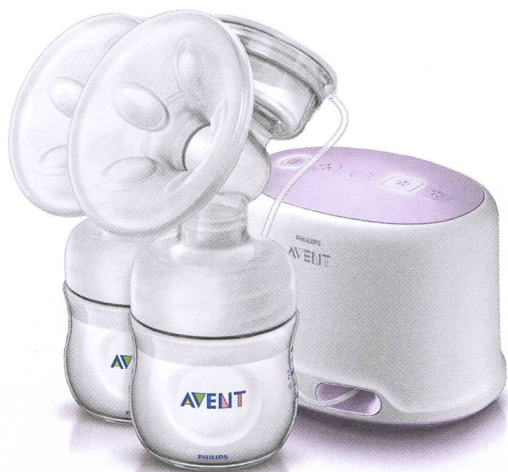
Tire-lait double électrique Natural

Les nouveaux tire-lait Natural de Philips AVENT ont été développés en collaboration avec les meilleurs spécialistes de l'allaitement en prenant exemple sur la nature. Ils permettent aux mamans de tirer leur lait de façon beaucoup plus confortable ce qui favorise la lactation.