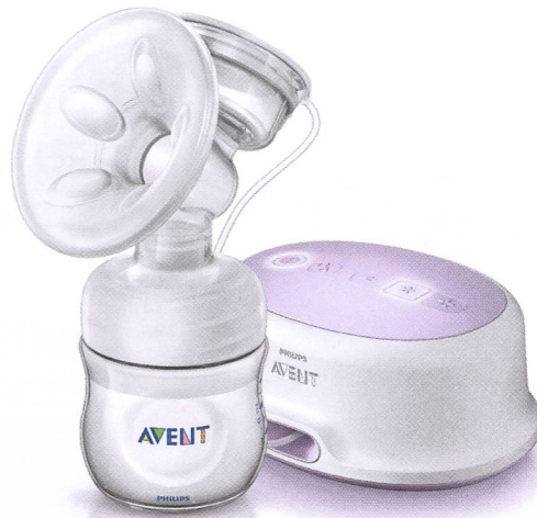
Tire-lait électrique Natural