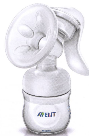
Tire-lait manuel Natural