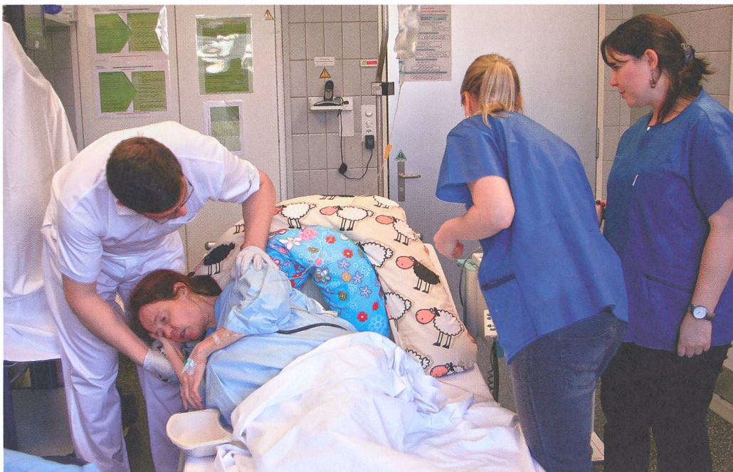
Im Simulationsraum während des Trainings.

der Beteiligten in solchen Grenzsituationen entscheidend. Wie Menschen unter Stress handlungsfähig bleiben, lässt sich im Simulator, ohne Gefahr für die Patientin und das Neugeborene, unter realitätsnahen Bedingungen üben. Danach wird das im Simulator Erlebte besprochen und reflektiert, mit dem Ziel, neue, verbesserte und effektivere Handlungsstrategien zu entwickeln und gleich beim nächsten Simulationsszenario auszuprobieren, wie dieses Neue ankommt.