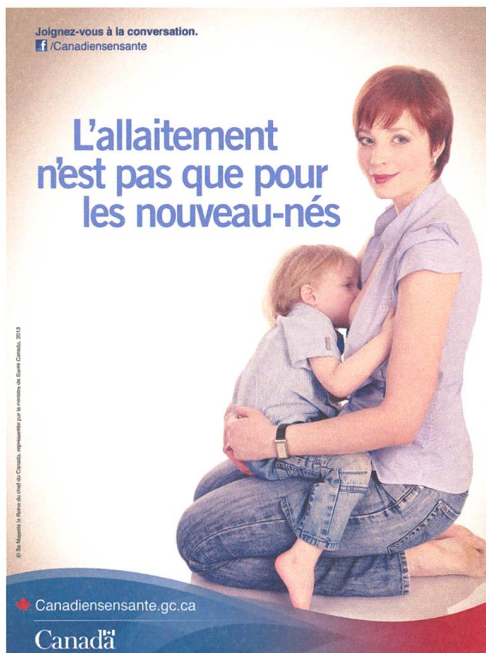
Affiche de «Canadiens en Santé», Gouvernement du Canada (2014).