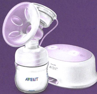
Tire-lait électrique Natural