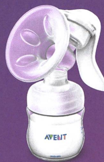
Tire-lait manuel Natural