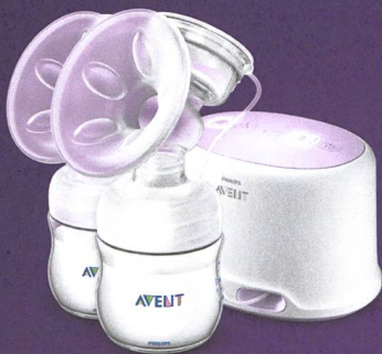
Tire-lait double électrique Natural

Les tire-lait Natural de Philips Avent ont été développés en collaboration avec les meilleurs spécialistes de l'allaitement en prenant exemple sur la nature. Ils permettent aux mamans de tirer leur lait de façon beaucoup plus confortable ce qui favorise la lactation.