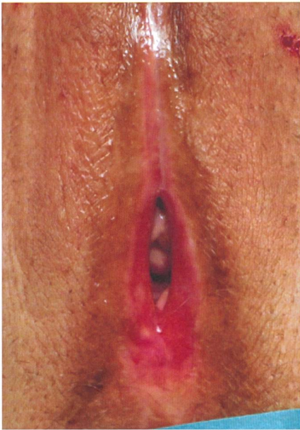
Lichen planus der Vulva, alle typischen Strukturen der Vulva sind kaum mehr erkennbar. Typisch sind die sehr dünne Haut und der rote Ring am Introitus.