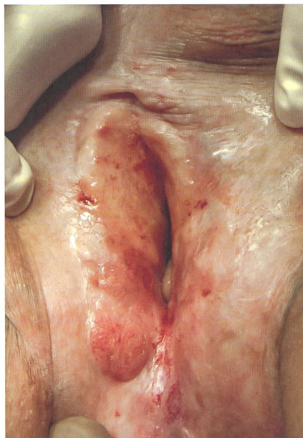
Über Jahre unbehandelter LS mit Krebsvorstufe an der rechten Labie.

sachen sind unbekannt, Schübe können aber v. a. durch Traumata im Genitalbereich ausgelöst werden. Auch Ernährung kann einen negativen Einfluss nehmen; berichtet wird von scharfem Essen oder auch säurehaltigen Getränken oder Zitrusfrüchten, die Unterschiede sind hierbei jedoch individuell erheblich. LS kann erblich sein, in etwa 50% der Fälle findet man weitere Familienangehörige, die betroffen sind (eigene, nicht publizierte Daten).