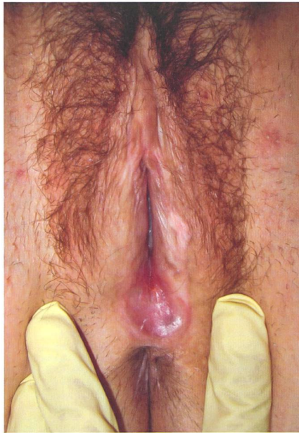
LS bei einer jungen Frau, kleine Schamlippen fehlen, der hintere Introitus ist vernarbt, diskrete Lichenifizierung linke grosse Schamlippe.