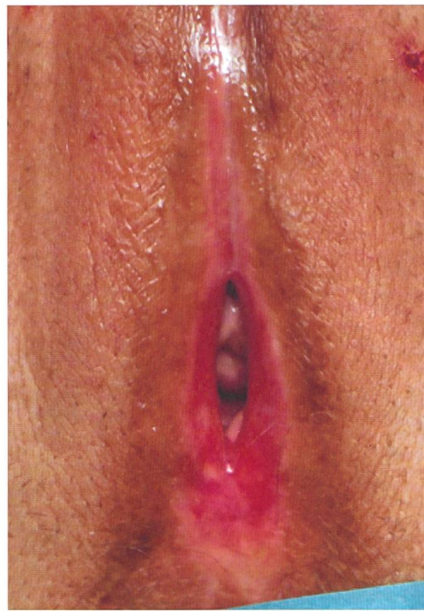
Lichen plan de la vulve, on ne reconnaît presque plus les structures typiques de la vulve. La peau très fine et l'anneau rouge à l'introitus sont typiques.

Plus d'informations sur www.lichensclereux.ch