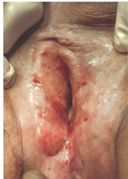
LS non traité pendant des années avec une précancérose à la lèvre droite.