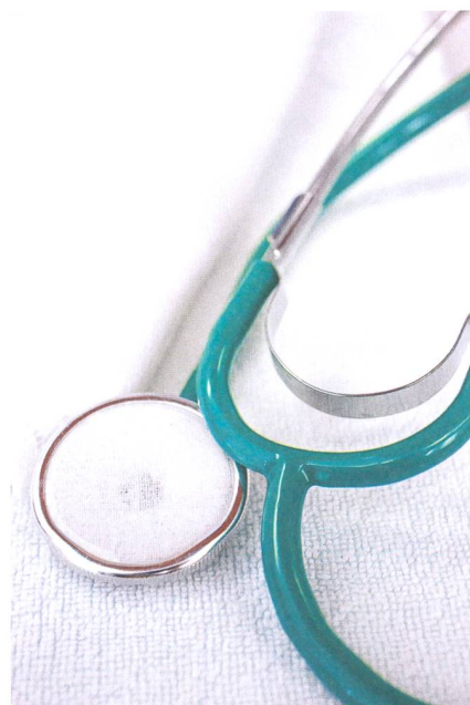
Berner Fachhochschule Gesundheit

Hebammen bewegen sich im Spannungsfeld zwischen einem physiologisch geprägten Geburtshilfeverständnis und dem medikalisierten Vorgehen im klinischen Alltag.