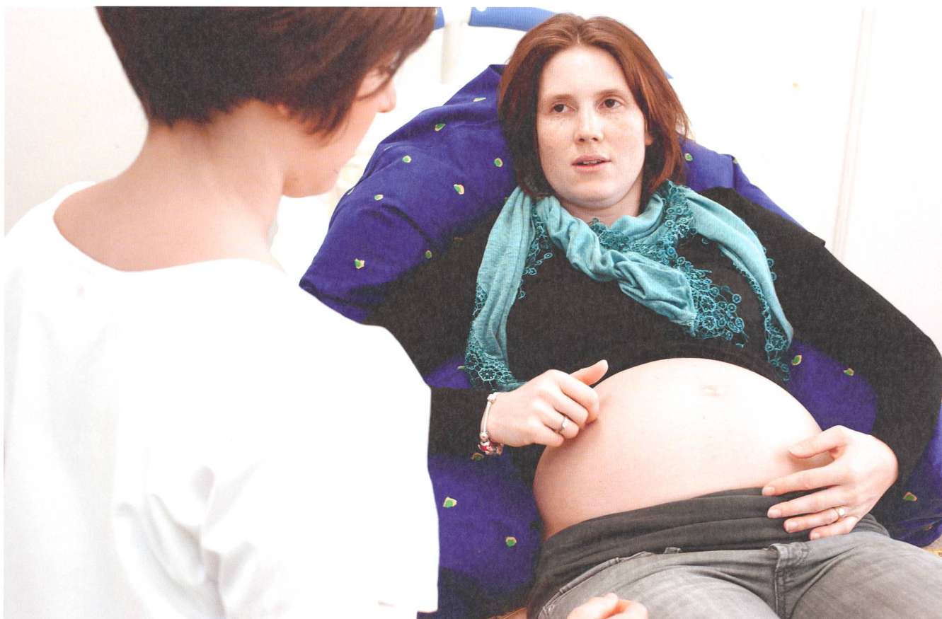
Berner Fachhochschule Gesundheit

Viele Frauen äussern den Wunsch nach einer natürlichen Geburt, jedoch soll diese unter den grösstmöglichen Sicherheitsaspekten stattfinden.