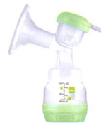
2in1 Einzelmilchpumpe 2en1 tire-lait individuel