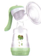
Handmilchpumpe Tire-lait manuel