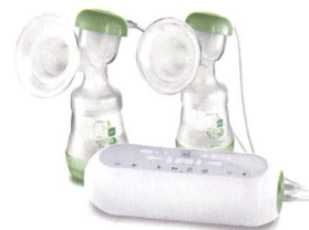
2in1 Doppel milchpumpe 2en1 tire-lait double