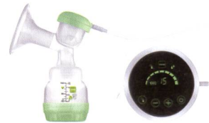
2in1 Einzel milchpumpe 2en1 tire-lait individuel