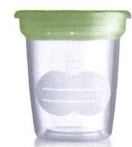
Aufbewahrungsbecher Pots de conservation