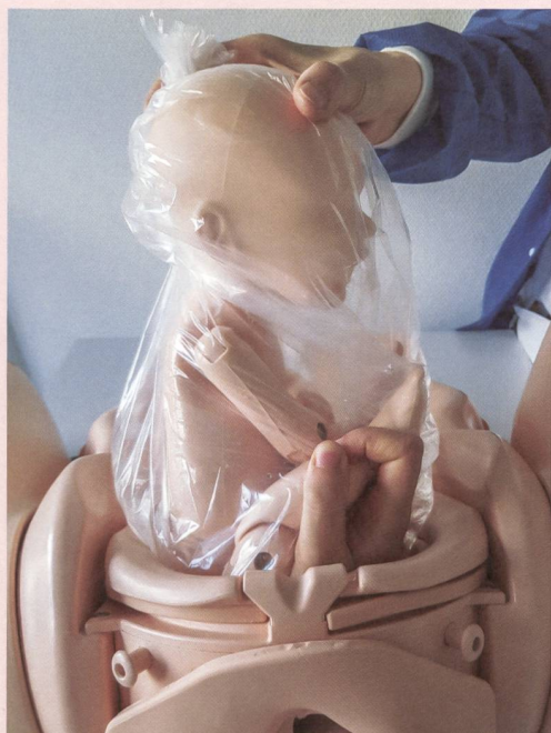
Figure 1: Simulation d'accouchement vaginal du deuxième jumeau en siège; SimMat, Hôpitaux Universitaires de Genève.