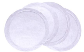
Stilleinlagen Coussinets d'allaitement