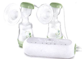
2in1 Doppelmilchpumpe 2en1 tire-lait double