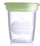
Aufbewahrungsbecher Pots de conservation