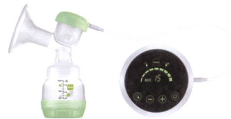
2in1 Einzelmilchpumpe 2en1 tire-lait individuel