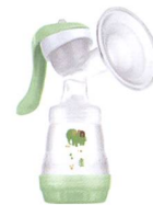
Handmilchpumpe Tire-lait manuel