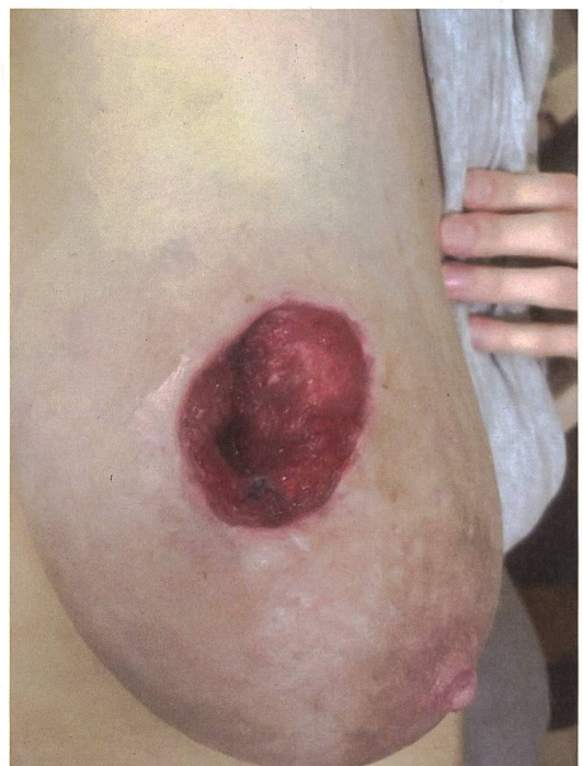
Tissu de granulation