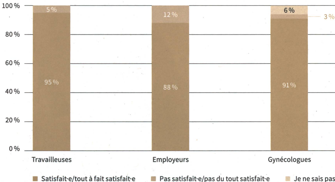
Figure 1. Niveau général de satisfaction des parties prenantes vis-à-vis de la consultation spécialisée en médecine du travail