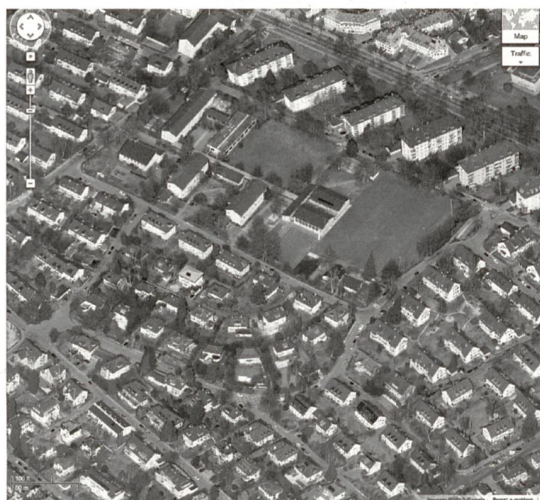
Aktuelle Vogelschau des Quartiers

von je 49,5 Meter erstellen. Die Stadt beanstandete insbesondere, dass dieses Projekt «den Charakter eines Villenquartiers» nicht wahre, und betonte, ein Alignementsplan, dem auch Sonderbauvorschriften beigegeben werden müssten, sei «unbedingt notwendig, um eine würdige Überbauung des schönen Baugeländes zu sichern und hässliche Spekulationsbauten zu verhindern». 9 In der Folge entstand ein juristisches Seilziehen um das Projekt der Wohnbaugenossenschaft Elfenau: Die Rekurse der Stadt und mehrerer Anwohner wurden vom Regierungsstatthalter abgewiesen, aber vom Regierungsrat gutgeheissen, der u.a. ebenfalls von einer «spekulativen Ausnützung der