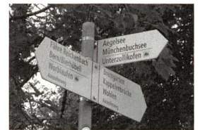
Wegweiser nach Münchenbuchsee beim Restaurant Reichenbach