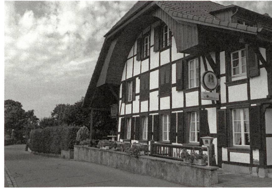
Resaturant zur Frohen Aussicht in Zollikofen