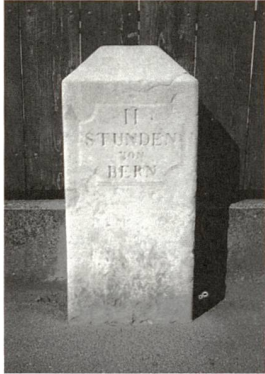
Stundenstein in Münchenbuchsee

Von meinem Balkon aus sehe ich auf den Stundenstein vor dem Gemeindehaus in Münchenbuchsee (Bernstrasse 12). Da lag der Gedanke nahe: «Auf welchem Weg kommt man eigentlich zu Fuss oder mit Ross und Wagen von «Buchsi» nach Bern?» Diese Frage ist nicht ganz leicht zu beantworten. Der Weg von Büren a.A. an der Moospinte vorbei zum Schloss Buchsi ist grad und einfach. Aber von hier nach Bern hat jede Epoche einen anderen Weg gesucht: