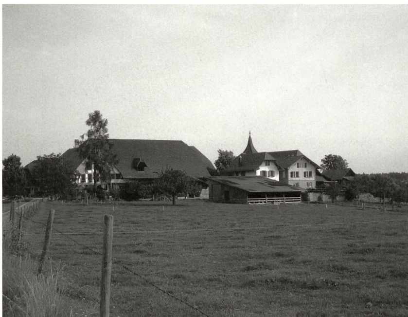
Der Weiler Büelikofen auf dem Weg von Zollikofen zur Neubrücke

Um 1840 baute der neue Kanton sein Strassennetz aus: Von der Worblaufenbrücke aus über Zollikofen nach Buchsi, Lyss und Büren a.A. Die neue Bernstrasse mit noblen Villen und Gasthöfen wurde nun «2 Stunden von Bern» zu den Champs-Élysées von Münchenbuchsee. Das Dorf drehte seine Entwicklungsachse nun zu zweiten Mal. Nach dem 2. Weltkrieg drehte das Dorf seine Richtung noch ein drittes Mal, weil die Bernstrasse mit zunehmendem Verkehr nicht mehr als Dorfachse dienen konnte, sondern eher als Grenze zwischen Ober- und Unterdorf wahrgenommen wurde. Nun übernahm die Oberdorfstrasse wieder ihre alte Funktion.