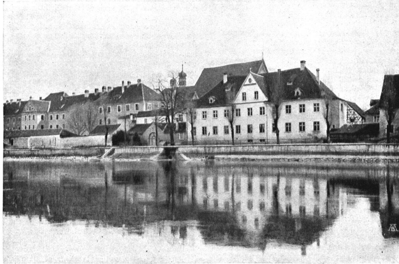
≡ DAS EHEMALIGE KLOSTER ST. KATHARINENTAL AM RHEIN (KT. THURGAU). ≡ ≡ L'ANCIEN COUVENT ST-KATHARINENTAL SUR LE RHIN (THURGOVIE). ≡

Wir hoffen, dass die hohe Regierung des Kantons Thurgau unsern lebhaften Protest gegen eine derartige Verschönerung vernehme und, sofern eine Erneuerung des Fassadenputzes durchaus notwendig ist, anordne, dass die Wiederherstellung im alten, auch in der Farbe zu Gelände und Umgebung einzig passenden Besenswurf ausgeführt werde mit all den Aussparungen an den Fensterumrahmungen, an den Gurten und sonstigen Architekturteilen in Weiss, wie sie der jetzige Zustand zeigt. Wird dann etwa noch die äusserste Ummauerung etwas heller gehalten und zum düstern Hauptgebäude in Gegensatz gebracht, so ist das reizvolle Stimmungsbild gerettet, und wir sind dem Staate Thurgau zu Dank verpflichtet, dass er praktischen Heimatschutz geleistet. (Ein Schaffhauser .)