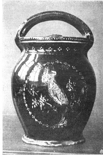
Die Kanne befindet sich im Schweiz. Landesmuseum in Zürich Au Musée national de Zurich

La forme répond bien au but et est en même temps ornementale, très réussie dans son ensemble. La décoration parfaitement appropriée aux surfaces