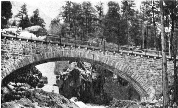
BEISPIEL: BRÜCKE DER BERNINABAHN bei den Berninabach - Fällen. BON EXEMPLE: UN PONT DU CHEMIN DE FER DE LA BERNINA, aux chutes de la Bernina

Heimatschutz im Kanton Freiburg. Gegen die Entstellung der Landschaften durch Reklameplakate ist unlängst dem Grossen Rate von Freiburg ein Gesetzentwurf unterbreitet worden, der Massnahmen vorsieht, welche als wirksames Mittel für den Heimatschutz nur freudig begrüsst werden können. Zu diesem Gesetz bemerkt ein Mitarbeiter der «Liberté», dass glücklicherweise die kaufmännische Reklame im Kanton Freiburg noch nicht den Umfang erreicht habe, wie in anderen Gegenden der Schweiz, welche durch die Reklameplakate aller ihrer alpinen oder ländlichen Schönheiten beraubt seien. Dennoch dürfe man sich nicht verheimlichen, dass auch im Kanton Freiburg dieses Unwesen von Jahr zu Jahr immer grössere Fortschritte mache und dass auch hier schon überall der Blick des Wanderers auf aufdringliche und verwirrende Affichen stosse, so dass er schliesslich