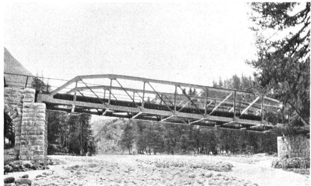
GEGENBEISPIEL: BRÜCKE DER BERNINABAHN beim Mortaratsch-Gletscher MAUVAIS EXEMPLE: UN PONT DU CHEMIN DE FER DE LA BERNINA, près du glacier de Mortaratsch

Architekturteile des Seehofes zu Meilen am Landesmuseum. Ein Besuch der umgewandelten Nordostecke des Landesmuseums, schreibt die N. Zürcher Ztg., gewährt grossen Genuss. Wenn Gotik und Rokoko auch nicht gerade eine Stilleinheit bilden, so nimmt es sich trotzdem sehr anmutig aus, dass die grünmawachsenen Spitzbogenfenster jener mit einer altertümlich erscheinenden dunkeln Patina bekleideten Mauerecke statt auf den leeren Kiesboden nun auf das feine, wie flandrisches Spitzgewebe aus Blättern, Ranken, Röschen und Blütengirlanden sich zusammensetzende Muster eines herrlichen schmiedeisernen Gittertores und Umzäunung herunterblicken. Gar stattlich flankieren das Tor die beiden hohen, mit fröhlichen Rokokoemblem geschmückten Steinpfeiler. Oben tragen sie je eine der für jene Epoche charakteristischen grossen Urnen, von deren Stirnseite uns lächelnd ein junger Frauenkopf anblickt, mit schlankem, perlengeschmücktem Hals und einem Faltenhäubchen auf der gepufften Frisur. Nur die beiden mythologischen Sandsteinmänner scheinen sich dem dunkeln, verschwiegene Schatten eines alten Herrschafts-