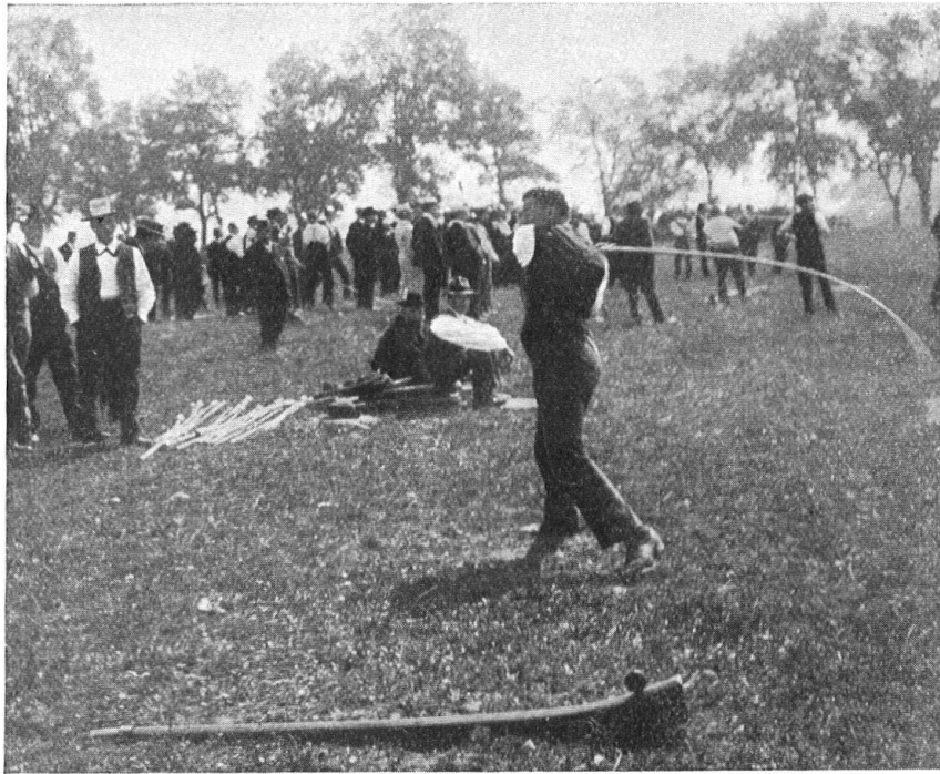
Abb. 7. Beim Hornussen. Absenden des Hornuss. Fig. 7. Joueurs de hornussen. Le lancement du projectile.

sind die Älplerfeste mit ihrem Steinstossen und dem Schwingen sicher reich genug! — Ihnen schliessen sich die Hornusserfeste an, welche die Spieler eines echt schweizerischen Rasenspieles jeweils vereinigen; hier kommt weniger ein Älplerbrauch zur Geltung als ein Bauernspiel des Mittellandes, das erfreulich grosse Anhängerschaft