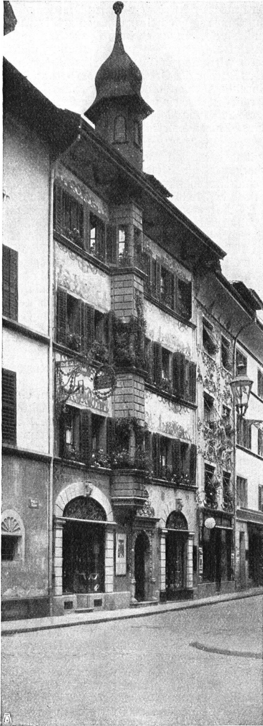
Abb. 9. Fassade des Bossard'schen Hauses an der Weggisgasse zu Luzern. Eines der schönsten alten Patrizierhäuser der Schweiz; sein drohender Abbruch sollte verhindert werden. — Fig. 9. Façade de la maison Bossard à Lucerne (Weggisgasse). Une des plus belles des vieilles maisons patriciennes suisses. Elle mériterait d'échapper à sa démolition imminente.