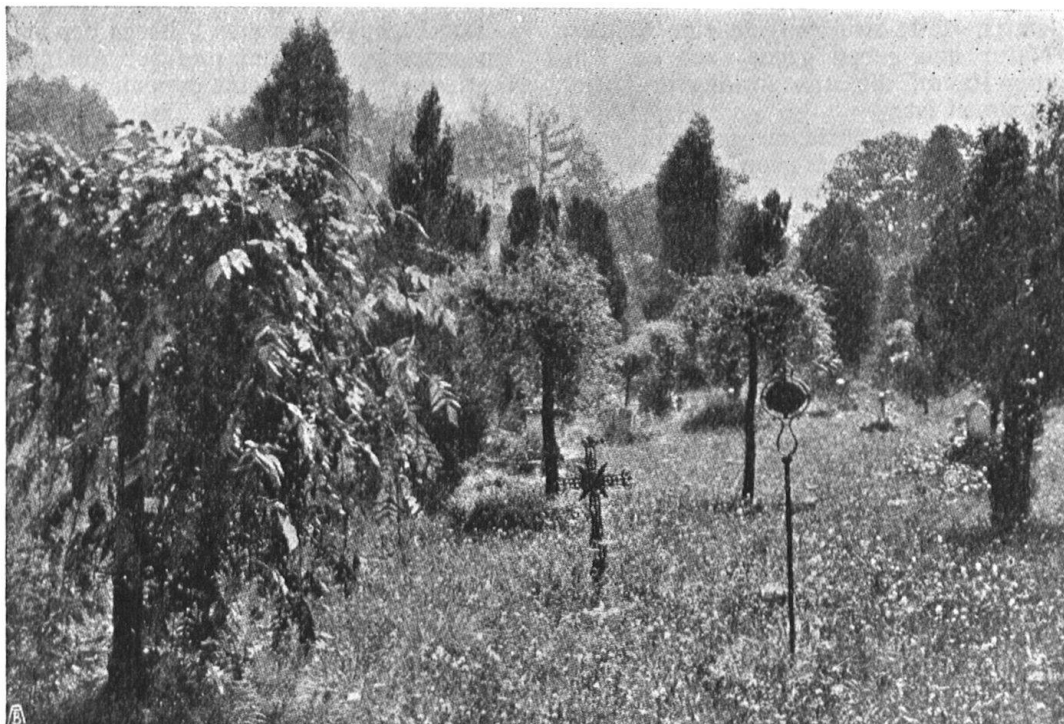
Abb. 16. Aus dem ehemaligen Rosengartenfriedhof in Bern. Laub- und Nadelhölzer in zwangloser Anordnung. Fig. 16. Dans l'ancien cimetière du Rosengarten à Berne. Les arbres feuillus sont mêlés pittoresquement aux conifères.