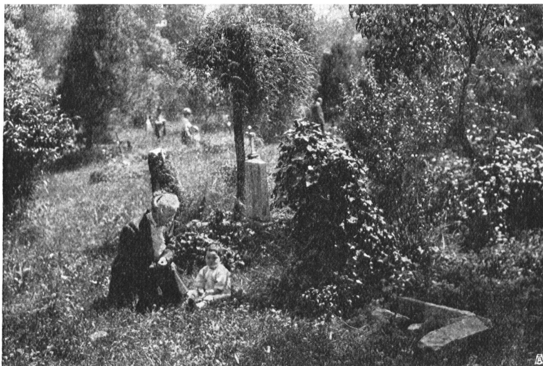
Abb. 17. Aus dem ehemaligen Rosengartenfriedhof in Bern. — Abb. 16 und 17 aufgenommen von H. Behrmann , Sommer 1913. — Fig. 17. Dans l'ancien cimetière du Rosengarten, à Berne.