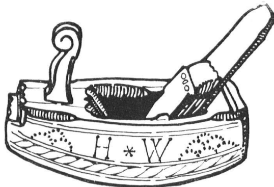
Abb. 3. Hobel (Twann). — Fig. 3. Rabot (Douanne).