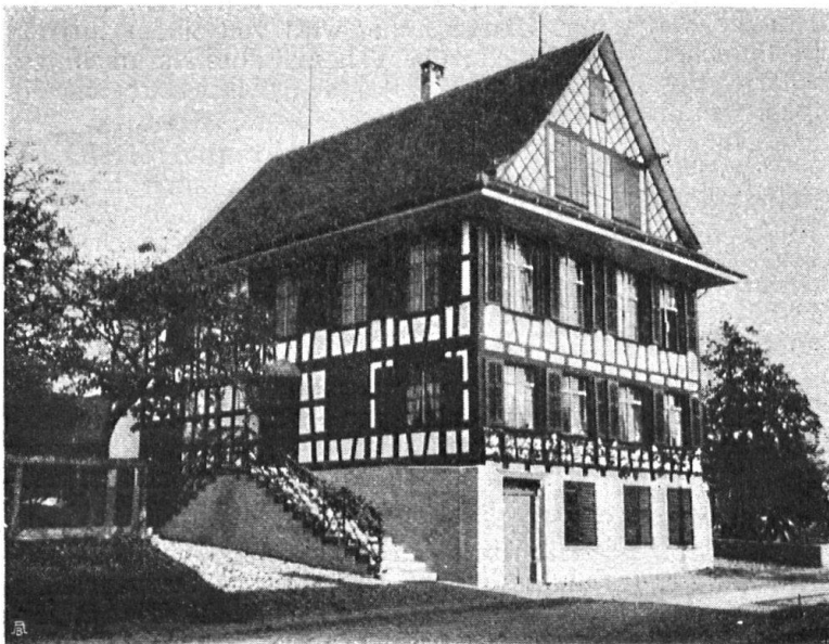
Abb. 16. Altes Schulhaus in Sulgen. Mit Sorgfalt renoviert. — Fig. 16. Ancienne maison d'école à Sulgen, qui a été restaurée avec soin.