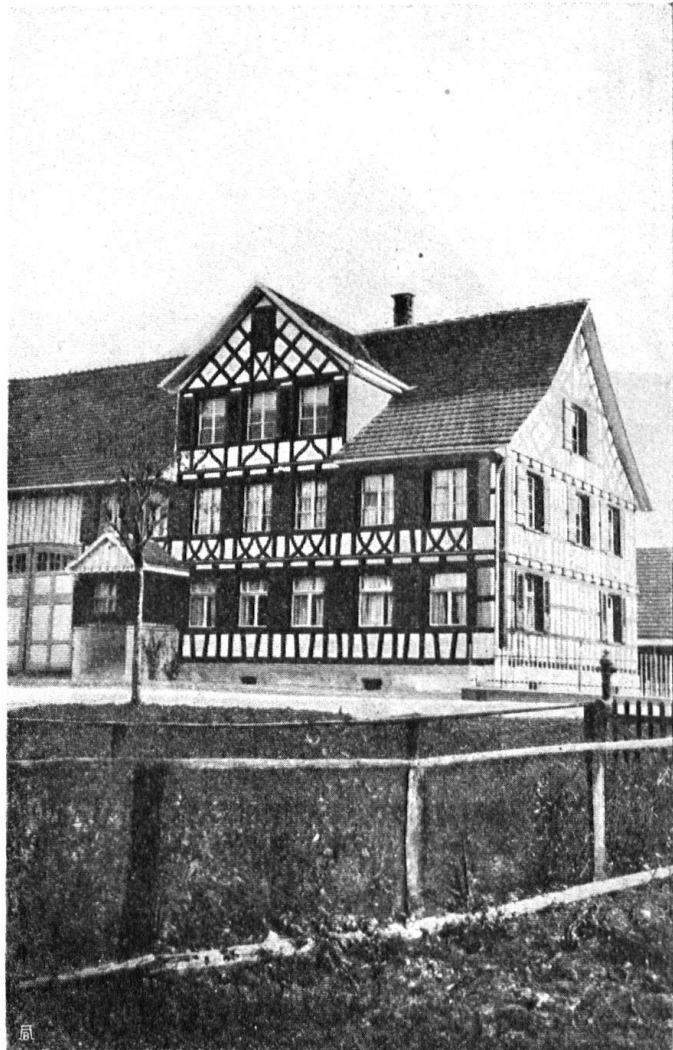
Abb. 17. Bauernhaus in Moos bei Amriswil, Vorderansicht des gut renovierten Hauses. — Fig. 17. Ferme à Moos, près Amriswil, qui a été restaurée avec goût.

Gleiches Lob und ebensolche Anerkennung verdient der Besitzer der Mühle Nussbaumen, der sogar unsre Vereinigung um fachmännischen Rat anging für seine Renovation. Auch hier entstand etwas ganz Gefreutes und die Mühle ist zur Sehenswürdigkeit des Dorfes und der Gegend geworden. Allen drei Bauherren unser Kompliment!