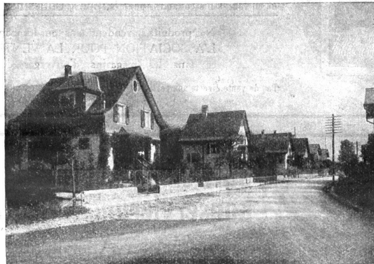
Eternithäuser - Kolonie · (1911-1913 erstellt)