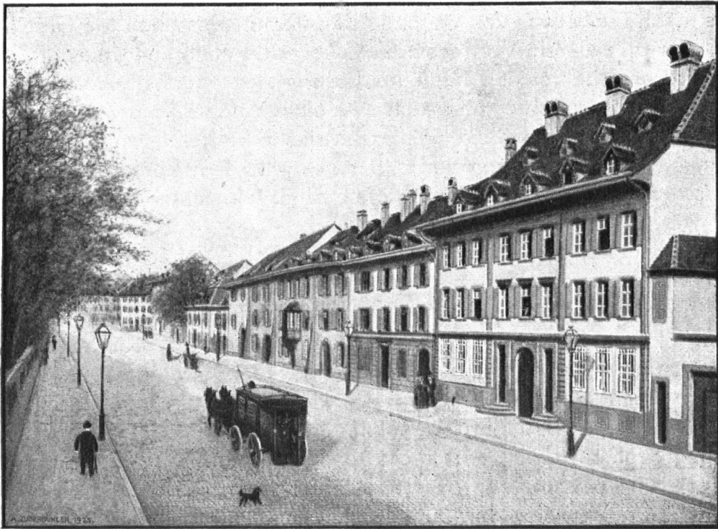
Abb. 14. Der St. Albangraben in Basel, vor dem Bau der Nationalbank, die heute an Stelle des Hauses mit dem Erker („Der grosse Colmar“) steht. Nach dem Originalaquarell von Albert Zuberbühler, Binningen. In Basler Privatbesitz. — Fig. 14. L'ancienne rue des Fossés Saint-Alban à Bâle, avant la construction de la Banque Nationale, qui occupe aujourd'hui la place de la maison à encorbellement. Aquarelle par A. Zuberbühler.