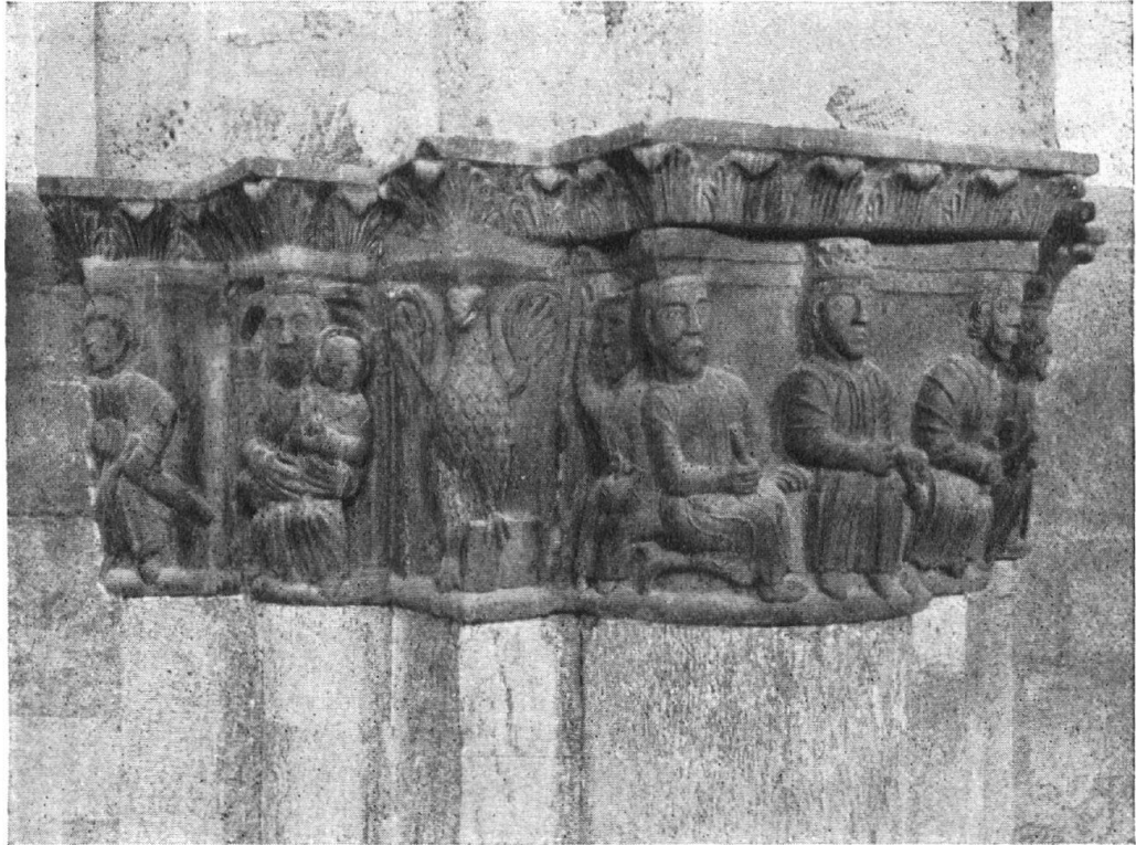
Abb. 4. Romanisches Kapitell. XII. Jahrh. — Fig. 4. Chapiteau roman. XII e siècle.