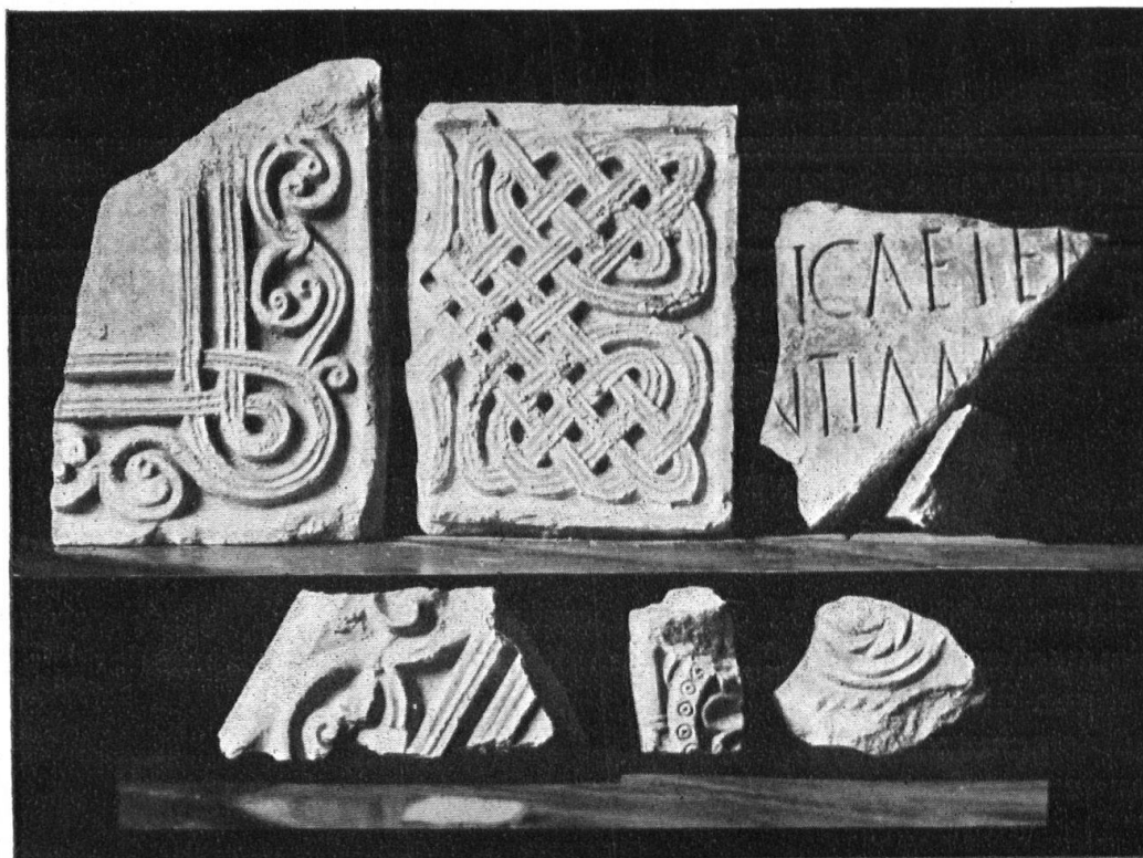
Abb. 2. Seltene Ornamente karolingischen Stils. Wohl aus der, im Jahre 821 zerstörten, Kirche stammend; durch die Restaurationsarbeiten zutage gefördert und jetzt geschützt. — Fig. 2. Fragments d'ornements rares de style carolingien, et qui proviennent probablement de l'église détruite en 821. Mis à jour par les travaux de restauration, ces débris sont maintenant soigneusement conservés.

monie zustande zu bringen. Die Kirche ist nämlich schon in ihrem ursprünglichen architektonischen Aufbau ein Kompromiss zweier Stile. Romanischen Baucharakter trägt die grosse Gruftanlage mit ihrem weitgespannten, auffällig flachen Gewölbe. Romanisch sind die massigen Säulenbündel, die Basen, die Kapitellskulpturen, in der Hauptsache die Portalfassade, ein Grossteil der Fenster und nicht zuletzt die fusseisenförmigen Seitenschiffarkaden. Ein gotisches Gewölbe mit breiten, vier-eckigen Tufgurten hebt mit seinen mächtig emporstrebenden Rippen den Ernst der geraden Linie und das Massigdüstere der unteren romanischen Bauteile auf. Der besondere Charakter des Churer Dombaues liegt in dieser Fortentwicklung des Romanischen zum Gotischen, in dem graugrünen Ton der Hausteine, die bis zur Kapitellhöhe reichen, im warmen, rötlichen Tuf der Gewölbegurten und in der stimmungsvollen Beleuchtung. Kein Joch ist wie das andere und keine Gewölbefläche deckt sich mit ihrem Gegenüber und doch ist die Verschiebung voll Harmonie. Die romanische Bauperiode hat Statuen in diesen Raum getragen, die an diejenigen von Chartres erinnern und menschenfressende Löwenfiguren, die zu denjenigen von San Zeno in Verona passen. Wir erinnern nur an die vier Apostelfiguren, die beim Gruft-eingang Aufstellung fanden und vor allem an die Prachtsfigur, auf welcher im Mittelpunkt der Gruft der Gewölbebau sich entlastet. Das Kapitell ist mit tragenden Engelfiguren geschmückt, die kurze Säule ruht auf einem Mann,