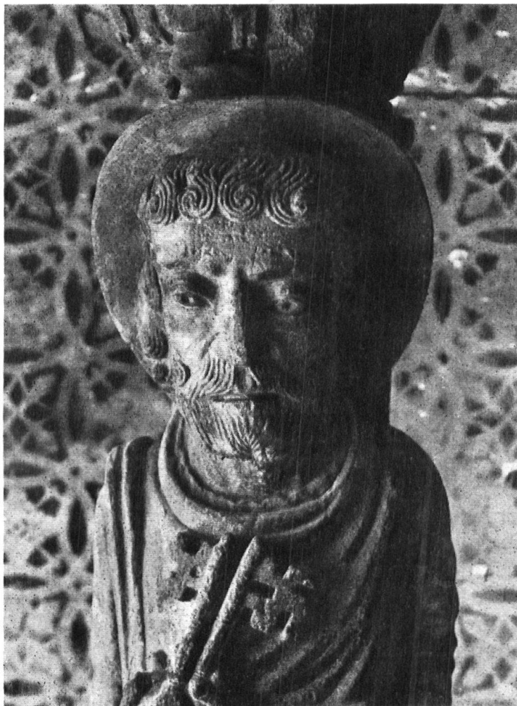
Abb. 1. Petrus-Statue. XII. Jahrh. Heute am Gruft-Eingang. Fig. 1. Statue de saint Pierre. XII e siècle. Se trouve aujourd'hui à l'entrée de la crypte.

Zweifellos war die Kathedrale von Chur, welche etwa von 1150—1250 erbaut wurde, und in welche die nachfolgenden Jahrhunderte nach jeweiligem Kunstempfinden und Laune ihre Gegenstände hineingestellt haben, für Ideen des Heimatschutzes eine vorzügliche Gelegenheit der Betätigung. Gerade dort, wo verschiedene Stile nebeneinander auftreten, hat der Heimatschutz seine liebe Not, um Har-