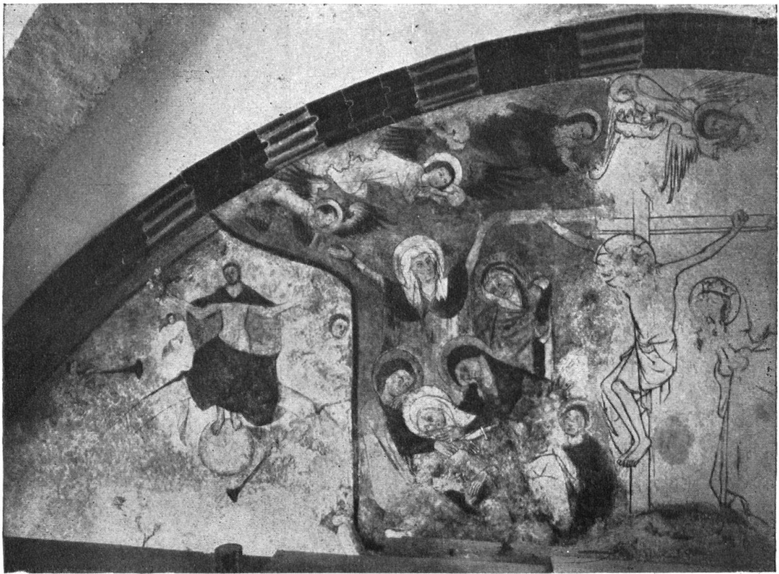
Abb. 6. Blossgelegte Freskomalerei. XIV. und XVI. Jahrh. -- Fig. 6. Fresques récemment découvertes du XIV e et du XVI e siècle.