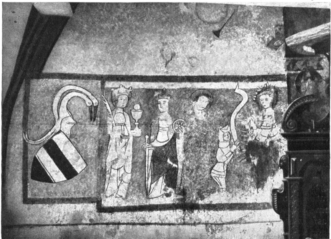
Abb. 7. Blossgelegtes Fresko. XV. Jahrh. Wappen der Ritter Tumb von Neuburg. Fig. 7. Fresque remise à jour, du XV e siècle. Armes des chevaliers Tumb de Neubourg.