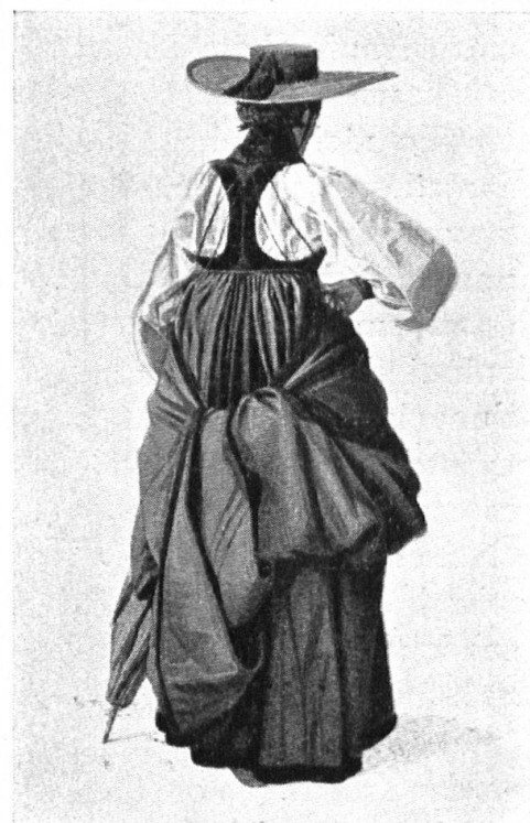
Abb. 5. Bäuerin aus Meiringen, 1855. Von Ruff. Fig. 5. Paysanne de Meiringen, 1855. Par Ruff.

besiegelt. Da helfen alle Bemühungen und Aufmunterungen, sie weiter zu tragen, nichts mehr. Sie wird zum Theaterkostüm. Wenn nun das moderne gesellschaftliche Leben der Menschen sich in einer Richtung entwickelt, welche das unveränderte Beibehalten der Volkstracht unmöglich macht, weil man damit in einen lächerlichen Kontrast zum herrschenden Geschmack kommt, so ist das nicht nur vom ästhetischen Gesichtspunkt aus zu bedauern, es ist ein untrügliches Symptom des Verschwindens der Naivität und deshalb bedenklich, weil die Naivität des Empfindens absolute Voraussetzung ist für das Entstehen echter Kunstwerte. Das künstlerische Schaffen ohne wirkliche Naivität vermag wohl interessante Werke hervor-