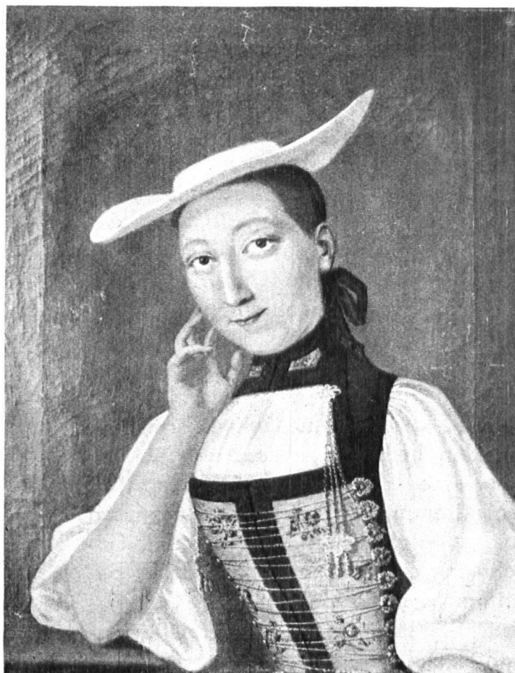
Abb. 1. Bürgerliche Frau aus Langenthal, 1785. Nach einem Bild von Samuel Fischer. — Fig. 1. Bourgeoise de Langenthal 1785. D'après une peinture de Samuel Fischer.

Die Tracht ist ein Bekenntnis. Vielleicht erregt diese Behauptung Kopfschütteln. Nichtsdestoweniger ist sie wahr. Nicht von jeher bedeutete es ein Bekennen, wenn man die Landstracht trug, denn es gab eine Zeit, da dies für die Landbevölkerung selbstverständlich war. Es sei mir gestattet, über diese Gedankenverküpfung hier ein paar Worte zu sagen. In Monarchien trägt der Soldat und oft auch der Beamte des Königs Rock. Das ist die schmeichelfhaft klingende Bezeichnung für die Uniform. Uniform trägt auch der republikanische Soldat, und bezeichnenderweise nannte man im Berner Volksmund ehemals die Uniform: Montur („Mundur“), denn man erblickte im Waffenkleid in erster Linie die Kriegsrüstung und nicht nur das Ehrenkleid, an welchem die Zugehörigkeit zu Staat und Truppe zu erkennen ist. Also des