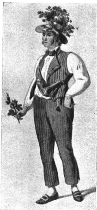
Abb. 7. Junger Bursche aus Freiburg zum Tanze angezogen. Nach Nikl. König 1820. — Fig. 6. Jeune homme de Fribourg, habillé pour la danse. D'après Nikl. König, 1820.

Sollen wir nun endgültig Verzicht leisten auf die verloren gegangene Kraft? — Nein, es gilt zu retten, was noch vorhanden ist, und es gilt, sich darauf zu besinnen, dass wir nicht rückwärts zu laufen brauchen, um sie wieder zu finden, sondern dass der gerade Weg, den das naive Empfinden schreitet, ja noch da ist. Wir müssen uns nur entschliessen, auf unsern Abweg zu verzichten und den geraden, ursprünglichen wieder zu gewinnen. Auf die Volkstracht angewendet, hiesse das: das Landvolk zur Erkenntnis führen, dass die Tracht in ihrer ursprünglichen, unverkünstelten Gestalt sich ganz gut mit den Hantierungen des täglichen Lebens verträgt, dass sie als Festtagsgewand sehr kleidsam und geeignet ist, die natürlichen Vorzüge unserer Volksstämme zur Geltung zu bringen, und endlich, dass die Verwendung solider, wenn auch teurer Stoffe, wie die Tracht sie erheischt, schliesslich die bessere