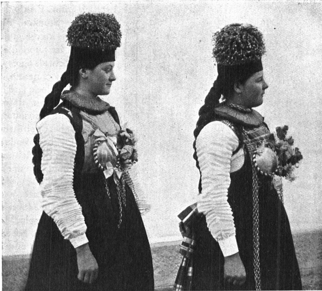
Abb. 10. Deutsch-Freiburgermädchen in der Prozessionstracht um 1900. — Fig. 10. Jeunes filles de la partie allemande du canton de Fribourg, en costume de fête pour la procession. Vers 1900.

habe sich so lange unverändert erhalten können, heisst es da, „weil keiner sich vom andern etwas nachsagen lassen oder vor dem andern etwas voraus haben wollte.“ Dass die Sennen heute noch manchenorts veraltete oder eigenartige Kleider tragen, liege, so wird ferner gesagt, „teilweise an ihrem einsamen Leben auf den Alpen und dann an der besondern Arbeit, aber auch an dem Stolz ihres Standes, dem Bewusstsein von der Wichtigkeit ihrer Viehzucht, ihrer Käse- und Butterbereitung.“ Die gemeinsamen Lebensbedingungen, die während sehr langer Zeit unverändert blieben, führten zu einer örtlichen Mode, die sich allmählich zur Tracht verhärtete. Das Wesentliche an derselben, eben das, was im gemeinsamen Empfinden wurzelt, blieb unverändert, und nur die von der persönlichen Eitelkeit verlangten Ausschmückungen wechselten mit der Mode. Die historische Erforschung der bernischen Volkstracht führte die Verfasserin des zit. Werkes auf Veränderungen, die ein Gemisch von Eigentümlichkeiten der jeweiligen neuesten Allerweltmode mit dem Überkommenen darstellen. Sie zeigen ein allmähliches Loslösen von ererbten Anschauungen und Sitten, dem sich