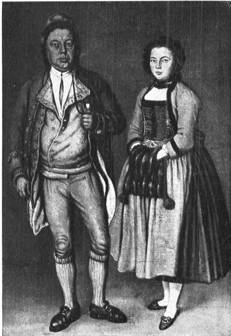
Abb. 4. Bauer mit Tochter aus Köniz in der Bernertracht der Rokokomode, 1790. Nach J. Reinhardt, Hist. Museum Bern. — Fig. 4. Paysan et sa fille de Köniz, dans le costume rococo de 1790. D'après J. Reinhardt. Original au Musée de Berne.

achten, wenn er es nicht darauf ankommen lassen will, dass man ihn nicht mehr für einen echten Stammesgenossen nimmt. Sobald er in seinem Habitus den individuellen Geschmack über eine gewisse Grenze hinaus zur Schau trägt, will er offenbar nicht mehr bloss als das schlichte Mitglied des Stammes gelten. Darin liegt das Wesen der Tracht. Wo aber liegt die Grenze dessen, was nicht verändert werden darf, ohne die Tracht ihrer Echtheit zu entkleiden? — Ja, wer das bestimmen könnte! Es ist eine Gefühlssache. Der Charakter der Tracht, in welchem der dem Stamm innewohnende Geschmack sich