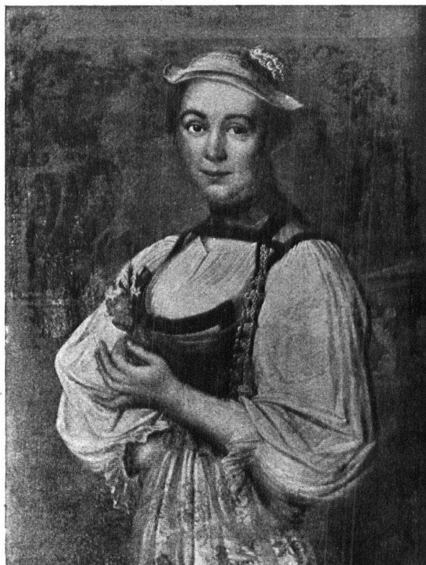
Abb. 8. Städtdame in der Bauerntracht der Rokokomode, elegant aufgemacht zu einem Festanlass. Nach J. Barth, 1754. — Fig. 8. Dame de la ville en costume paysan de l'époque rococo. Toilette élégante de fête. D'après J. Barth, 1754.