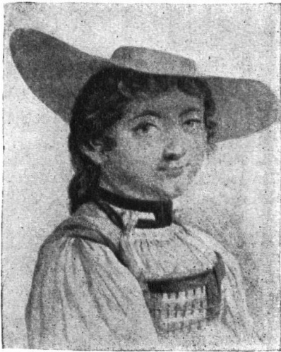
Abb. 2. Bernertracht der Rokokomode. Nach M. G. Eichler, 1812. — Fig. 2. Costume bernois de l'époque rococo. D'après M. G. Eichler, 1812.

einer bestimmten Schicht — zum Bauernstande — dieses Volksstammes. So wenigstens sollte es sein andernfalls spielst du, die Volkstracht tragend, Komödie. Das ist es, was die Tracht gemeinsam hat mit der Uniform, aber auch nur das. Für die Tracht gibt es keine Ordonnanz, die haargenau die Beschaffenheit des Kleides bestimmt und jegliche Variante verbietet. Die Uniform ist auf Befehl gemacht, nach der Laune und dem Geschmack des Befehlshabers. Die Tracht hingegen ist gewachsen, wie eine Pflanze wächst, dem Angehörigen des Stammes gewissermassen auf den Leib gewachsen, und sie hat wie eine Pflanze ihre Wurzeln im Volksstamm, in seinen Bedürfnissen und Gewohnheiten, in seinem Geschmack, in seinen besondern Begriffen von Schönheit und Gefälligkeit. Sie lässt kleine individuelle Varianten zu, je nach der Art des einzelnen Trägers. Ein gewisses Etwas aber darf der Einzelne nicht miss-