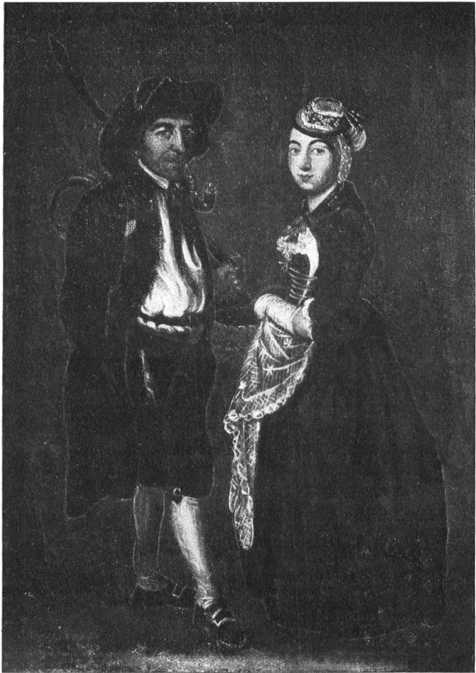
Abb. 9. Bauernpaar aus Bouveret in der Wallisertracht. Nach J. Reinhardt, Hist. Museum Bern, 1796. Fig. 9. Jeunes mariés du Bouveret. Costume valaisan, 1796. D'après J. Reinhardt. Original au Musée de Berne.

fasserin richtig sagt, wegen ihrer grossen Verbreitung irrtümlicherweise in den Augen des Auslandes oft als die Schweizertracht schlechthin bezeichnet wird.