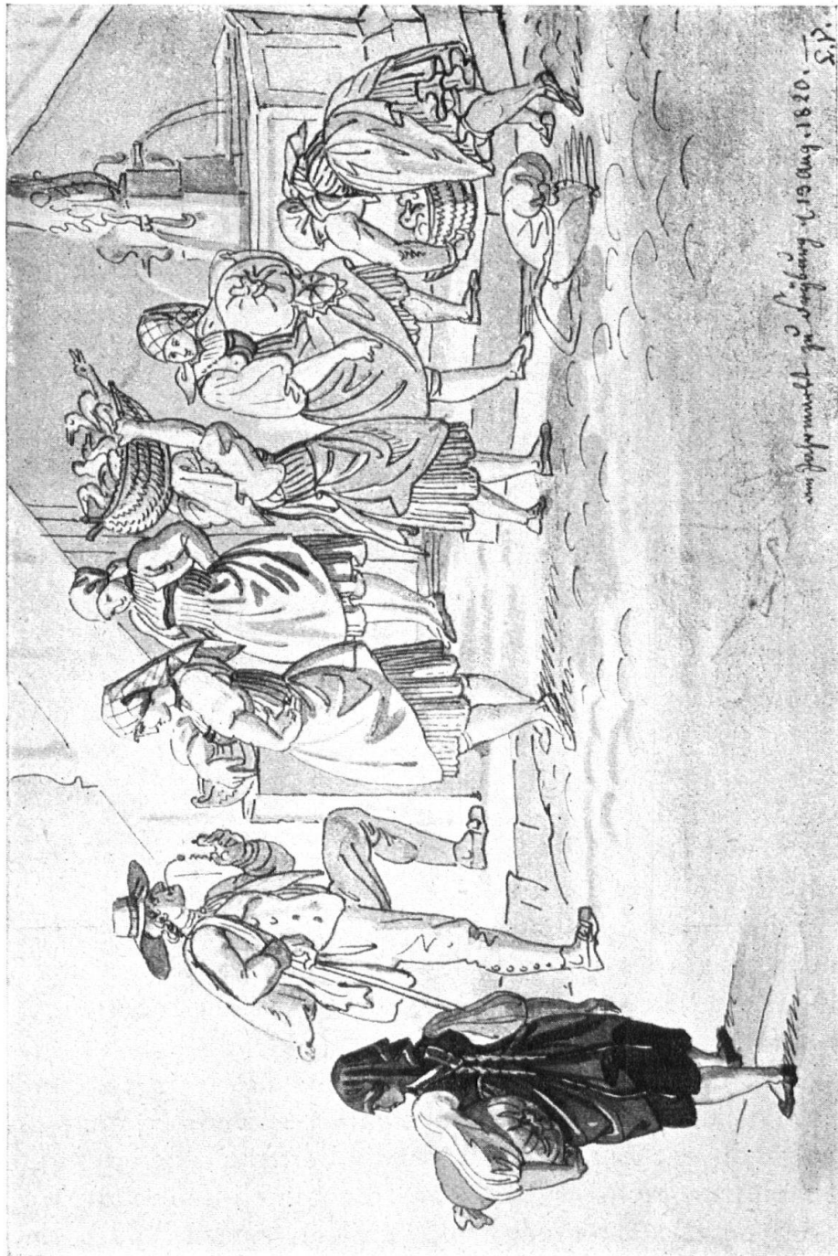
Abb. 13. Guggisbergerinnen auf dem Markt zu Freiburg, 1820. L. Vogel. Original im Landesmuseum. — Fig. 13. Femmes et jeunes filles de Guggisberg au marché de Fribourg, 1820. D'après L. Vogel. Original au Musée national.

er einer Bernerin in der unverkünstelten Tracht begegnet. Noch lebt viel gesundes Wesen im Bernerland. Auf Erhaltung desselben sollten die Heimat-