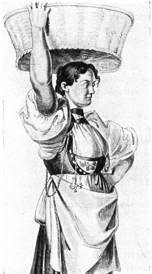
Abb. 3. Bernertracht der Empiremode 1816. Nach L. Vogel, Schweiz. Landesmuseum. — Fig. 3. Costume bernois de 1816, Mode empire. D'après L. Vogel. Original au Musée national.

An der Tracht erkennt man deine Zugehörigkeit zu einem Volksstamm und bis zu einem gewissen Grad die Zugehörigkeit zu