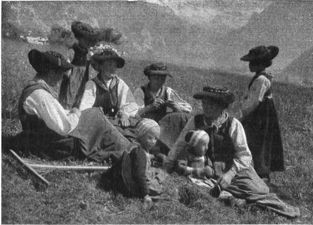
Abb. 14. Heuerinnen in Evolena (Wallis). Aufnahme von W. Gallas, 1925. — Fig. 14. Faneuses d'Evolène (Valais) Photographie de W. Gallas, 1925.

P. S. Soeben kommt mir die kleine, von Rudolf Mürger mit genauester Sachkenntnis verfasste und fein illustrierte Broschüre „ Berner Trachten “ zu Gesicht, welche die Sektion Bern der Schweizerischen Vereinigung für Heimatschutz herausgegeben hat. Mit Genugtuung und Freude stelle ich fest, dass sich die darin ausgesprochenen Ansichten völlig mit den meinigen decken.