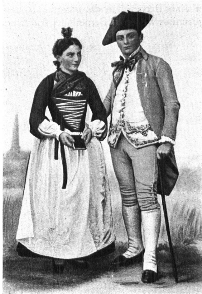
Abb. 12. Brautpaar aus dem Lötschental (Wallis) in der Tracht zu Anfang des 19. Jahrhunderts. Aufnahme aus dem Festzug zur Einweihung des Schweiz. Landesmuseums, 1896. Originaltracht im Landesmuseum. — Fig. 12. Jeunes mariés du Lötschental, commencement du XIX e siècle. Costume photographié lors du cortège organisé, à l'occasion de l'inauguration du Musée national, en 1896. Ce costume est conservé au Musée national.

Noch besser aber gefiele es mir, wenn man sich darauf besinnen wollte, dass die Volkstracht ein Bekenntnis sei zu echter Schweizerart und wieder danach streben würde, dieses alten Ehrenkleides von innen heraus würdig zu werden, so dass jedermann wüsste, mit wem er es zu tun hat, wenn