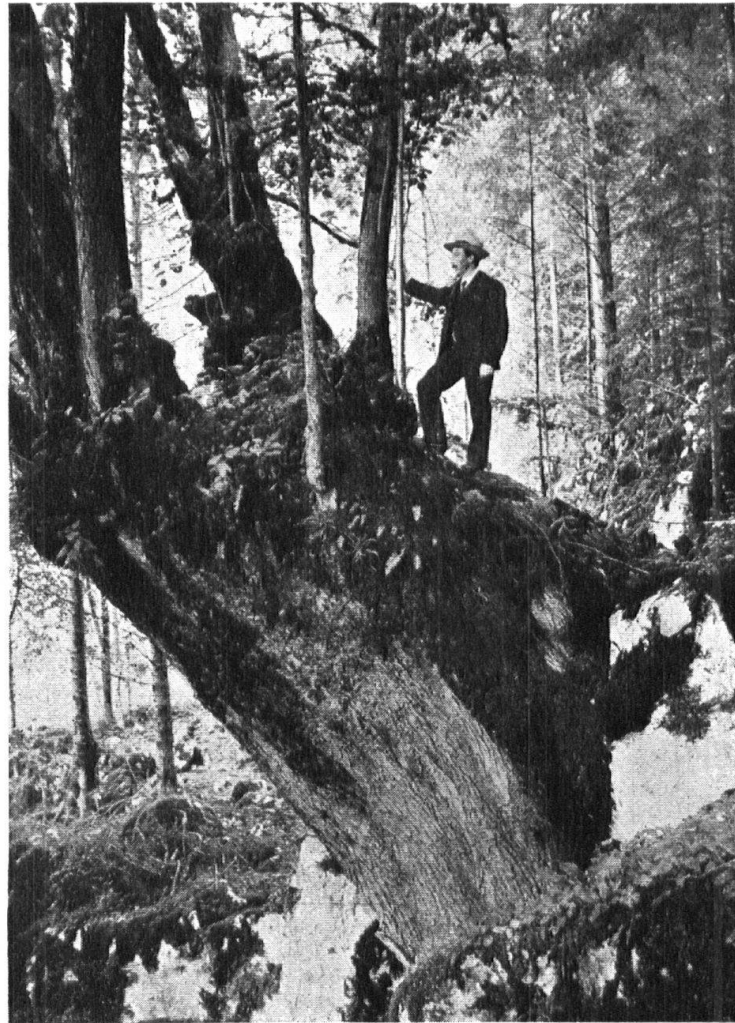
Abb. 15. Typische Linde im Bergwald zwischen Iseltwald und Giessbach. Fig. 15. Tilleul caractéristique entre Iseltwald et Giessbach.

Von der Gandriastrasse. Der Tessiner Grosse Rat hat am 14. Juni auf seine frühere, die mittlere (untere) Trasse vordringende Entscheidung hinweisend, nach längerer Diskussion gegen eine einzige