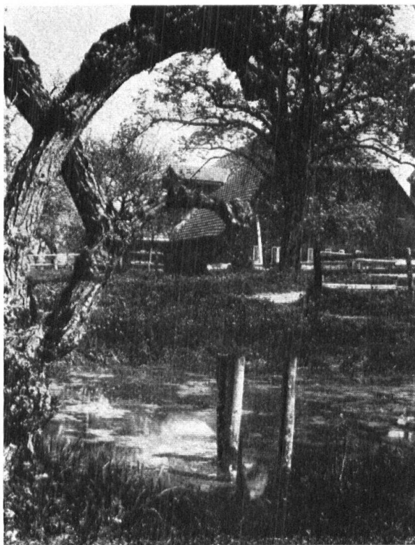
Abb. 12. Guter Feuerweiher in Schlosswil, Kanton Bern, dem die Feuerwehrkommission die Tauglichkeit abgesprochen hat. Durch Vertiefung, hölzerne Uferbefestigung und Auslauf wie bei Abb. 2 könnte er allen Ansprüchen genügen. — Fig. 12. Bon étang à Schlosswil, canton de Berne.

schulen gut bewurzelte Pyramidenpappeln kommen lässt, von denen das Stück, je nach Höhe des Baumes, zum Preise von Fr. 4.— bis 10.— erhältlich ist. Die Pflänzlinge sind in den ersten Jahren an Baumpfähle zu heften und gegen äussere Beschädigung mit einer Umwehrung zu schützen, z. B. mit einem Gestell, bestehend aus drei Pfählen und Drahtgeflecht, Schilf oder Dornen. Setzt man sie gar in der Nähe eines Misthaufens, so werden ungeheuer stattliche, hohe Bäume daraus. Was hier von der Pyramidenschwarzpappel, oft auch italienische Pappel genannt, gesagt ist, gilt auch von der Silberpappel und ihrer Abart, der Pyramiden-Silberpappel mit weissfilzigen Zweigen und Blättern sowie der Zitterpappel, welche drei die von den 20 verschiedenen Pappelarten am meisten bei uns kultivierten sind. Albrecht.