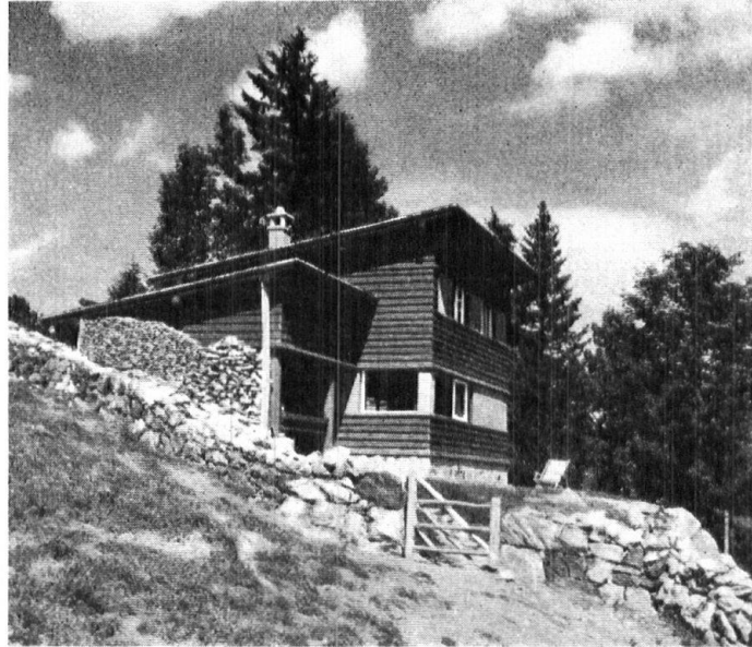
Ferienhaus auf Braunwaldalp.