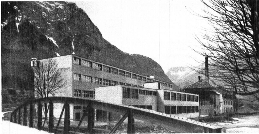
Baumwolldruckerei Hohlenstein, Glarus.