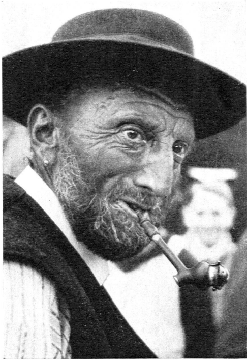
Bauer aus Grabs im Rheintal.