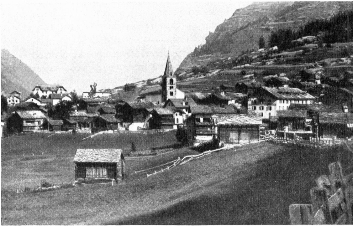
Dégâts anciens d'un beau paysage. — Le village d'Evolène affligé d'hôtels disproportionnés. — Verwüstung einer unserer schönsten Landschaften. Evolena im Wallis mit einigen Grossbauten, die sich nicht ins Dorfbild fügen.