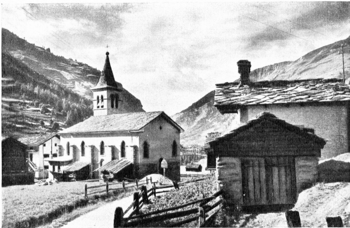
Signes de beauté: une chapelle vient d'être édiée aux Haudères, conformément au style architectonique de la contrée: toit couvert de dalles, clocher en cailloux roulés. A l'intérieur, fresques du peintre F. de Ribaupierre. — Das Verständnis für den Zusammenklang der Bauwerke setzt wieder ein. In Haudères bei Evolena wurde eine Dorfkirche gebaut, die mit Steinplatten bedacht wurde; der Turm ist aus Feldsteinen errichtet. Im Innern Fresken von Ribaupierre.