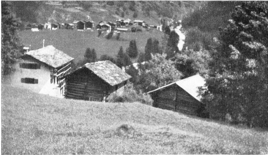
A droite, un toit de tôle brutal détruit l'harmonie naturelle de ces maisons dont la pierre et le bois sont enfants du pays valaisan. — Das Haus rechts erhielt ein Blechdach, das die reizvolle Stimmung des Dorfbildes in roher Weise zerstört. Die ländliche Bauart ist durch Holz und Stein bedingt und erträgt kein glitzerndes Blech.