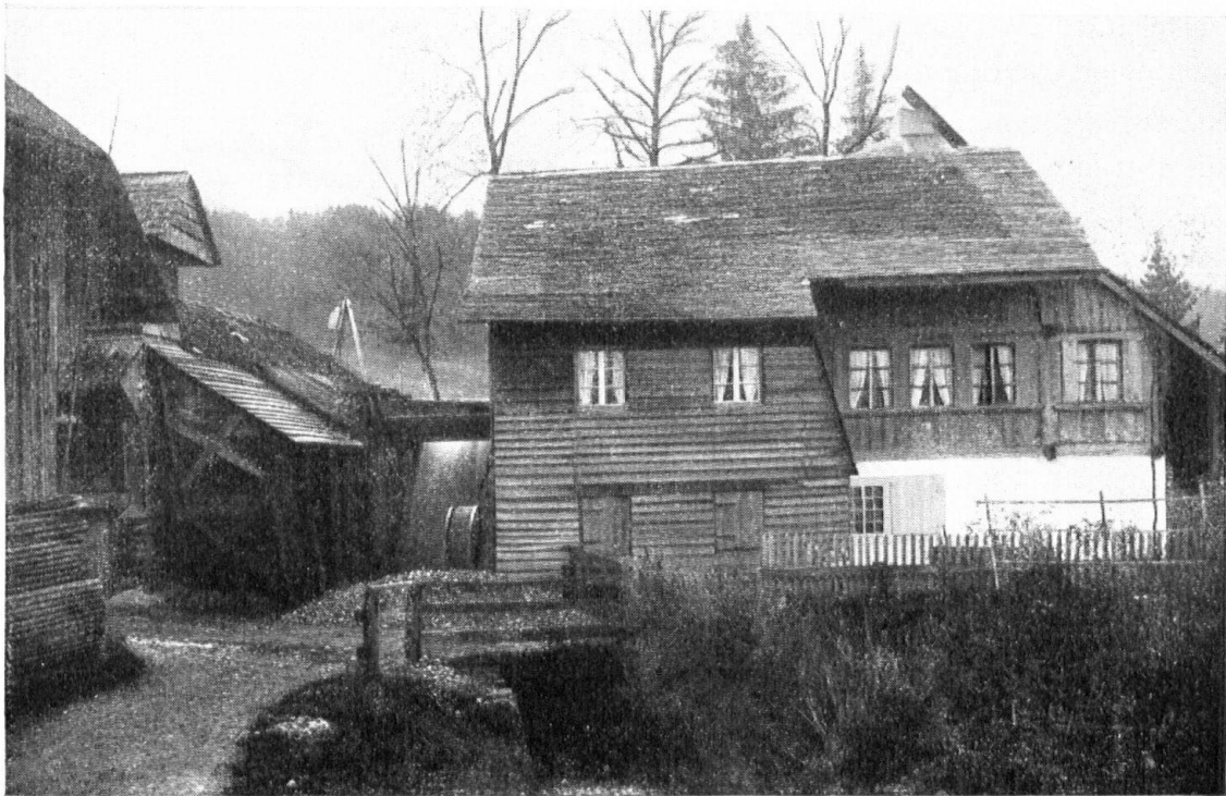
Vieille scierie, près de Bulle. Toit de bardeaux, intelligemment entretenu. Ce genre de couverture n'est plus autorisé que pour les demeures isolées. — Alte Säge bei Bulle mit verständig gepflegtem Schindeldach. Leider ist dieser Dachbelag nur noch bei freistehenden Häusern erlaubt.