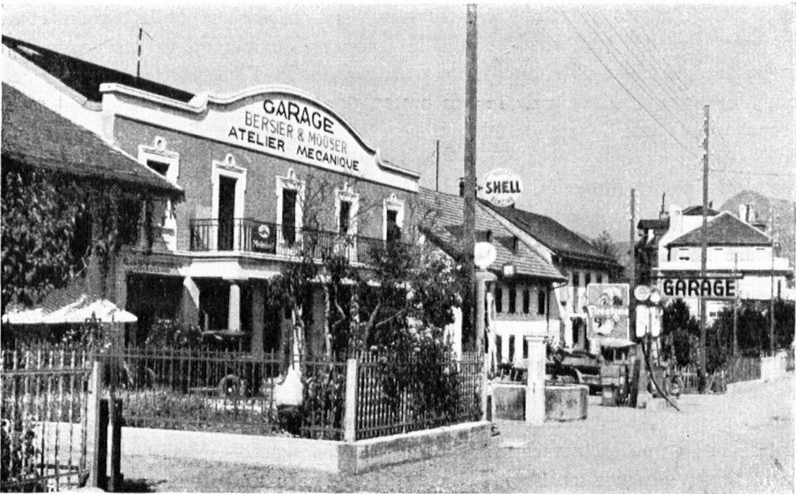
Ancienne maison foraine des Préalpes, érigée en garage. A l'arrière-plan, une maison badigeonnée en mauve. Fils, poteaux, affiches, écriteaux se concertent pour annoncer le progrès . . . et enlaidir un honnête quartier. — Altes Wohnhaus aus den Voralpen, das zur Garage umgebaut wurde. Im Hintergrund vor einem malvenfarbig getünchten Haus: Drähte, Telegraphenstange, Schrifttafeln und Plakate als Kennzeichen des Fortschritts und der damit verbundenen Hässlichkeit.