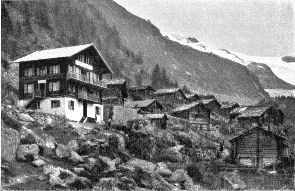
L'auberge de Ferpècle formerait avec le hameau un ensemble convenable si elle n'était coiffée de la lugubre tôle. — Eine Gruppe echter Alphütten mit einem falschen und geleckten Chalet links, das mit Blech eingedeckt ist.