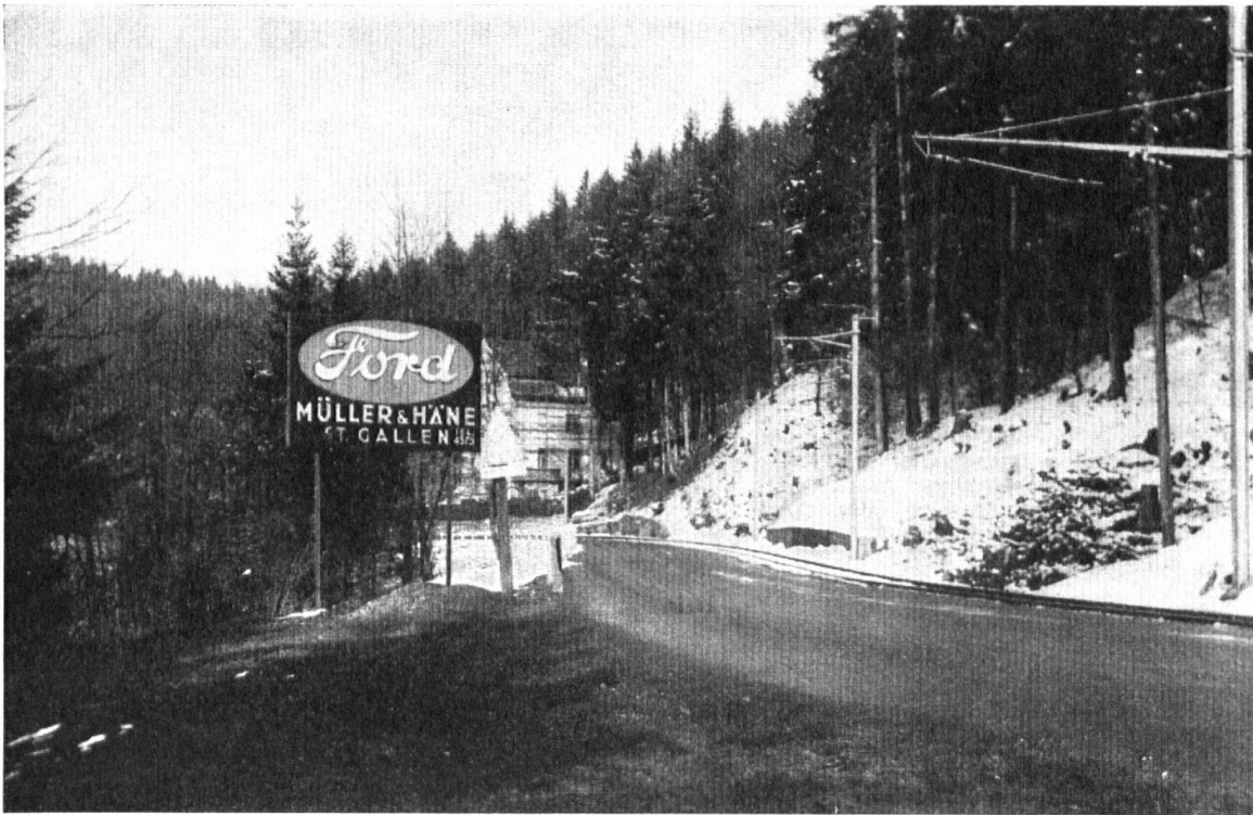
Autoreklame im Watt bei Teufen, Appenzell. — Affiche d'automobile dans une gorge d'Appenzell.

NACHDRUCK DER AUFSATZE UND MITTEILUNGEN BEI DEUTLICHER QUELLENANGABE ERWÜNSCHT