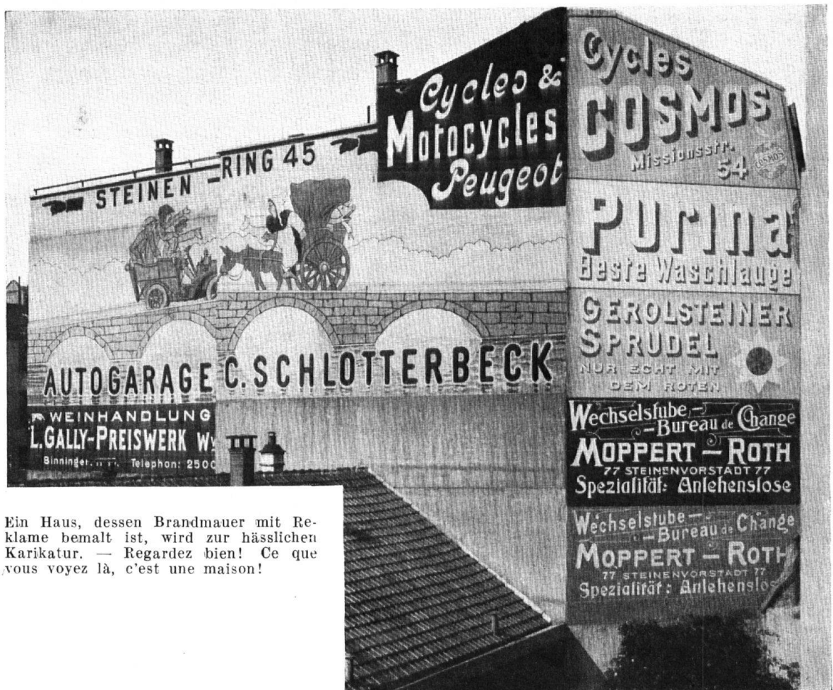
Ein Haus, dessen Brandmauer mit Reklame bemalt ist, wird zur hässlichen Karikatur. — Regardez bien! Ce que vous voyez là, c'est une maison!

Alle Zierschriften haben sich da zusammengefunden, alles schlägt sich gegenseitig mit grossem Geschrei tot; der Lärm der Großstadt, dem man entfliehen wollte, verletzt hier statt den Ohren die Augen. Das ganze, ordentlich bürgerliche Quartier ist geschändet. Merkwürdig, dass niemand dem Krämer erklärt: wenn Sie sich in unserer Gegend nicht anständig betragen, kaufen wir anderswo ein.