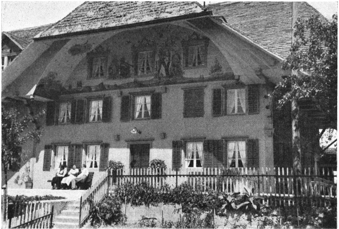
Das Gasthaus von Oberwald bei Burgdorf mit seinen eigenartigen Malereien. — L'auberge de Oberwald près de Berthoud avec ses peintures, datées de 1762.