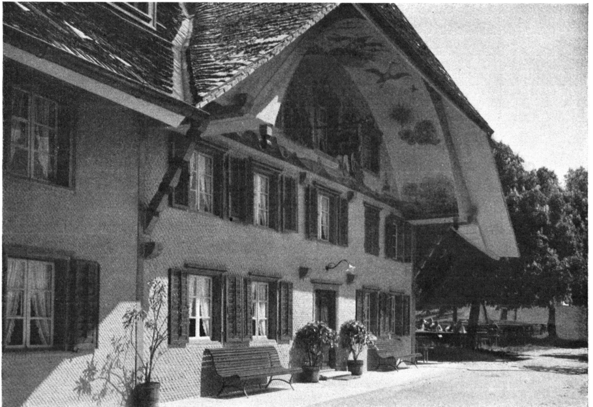
Blick in die Ründe des Hauses, die uns das Zusammenklingen von Hauswand und Verschalung zeigt. — Un regard sous le toit nous fait voir, comme une seule composition couvre la partie supérieure de la façade et les planches du toit.