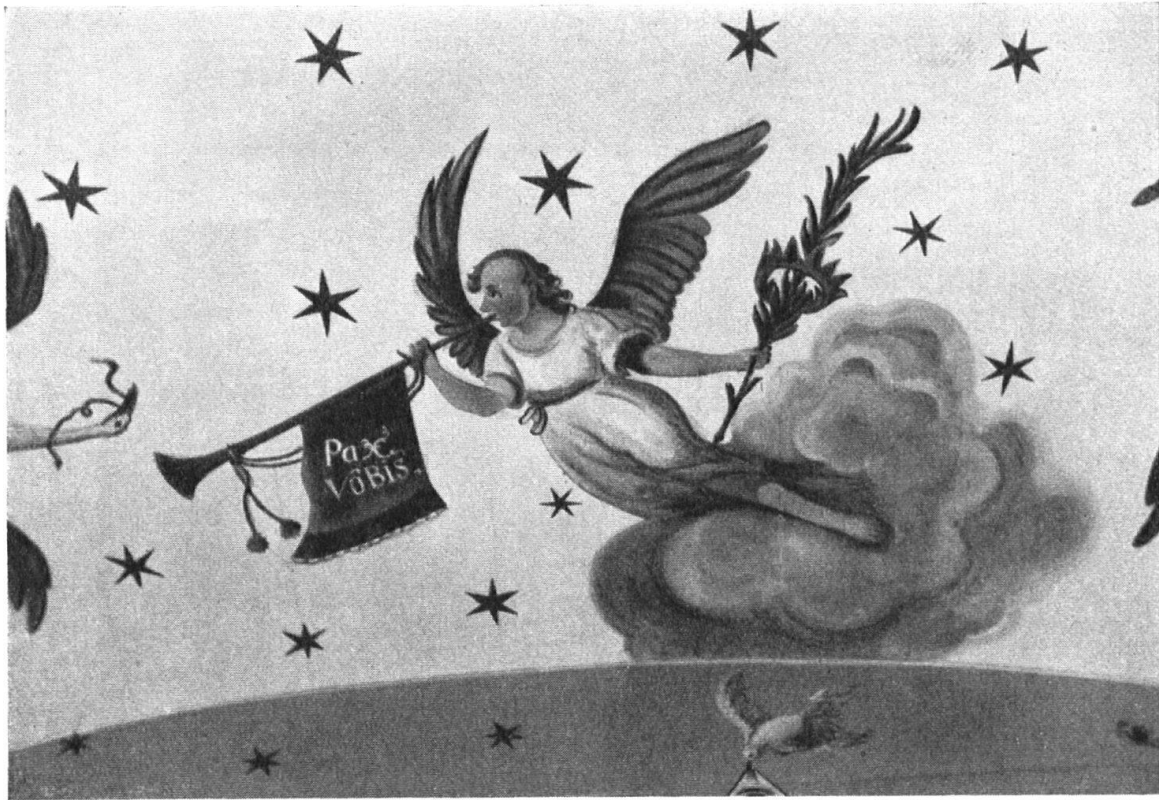
Der Friedensengel zuhöchst unter der Verschalung. — L'ange de paix dans la partie la plus haute du ciel.