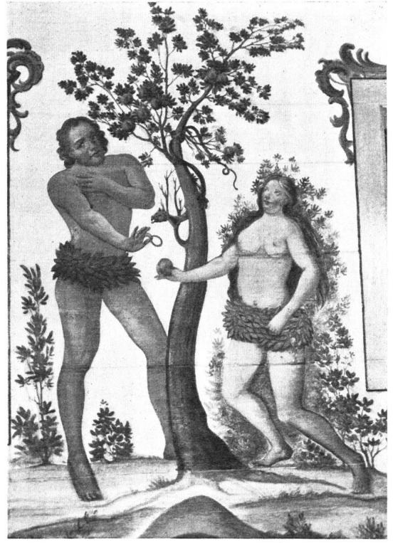
Der Sündenfall und die Vögel des Himmels. — Aux façades de chalets bavaroises, dans la contrée de Mittenwald, nous voyons des fresques avec les mêmes oiseaux et la même figure d'Adam, vêtu d'une couronne de feuilles.