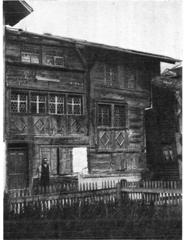
Studen-Mathisen-Haus. — Ancienne maison en bois.