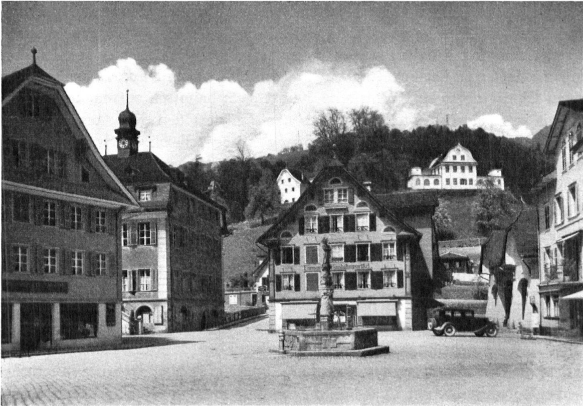
Dorfplatz mit Landenberg. — La place avec la colline de Landenberg