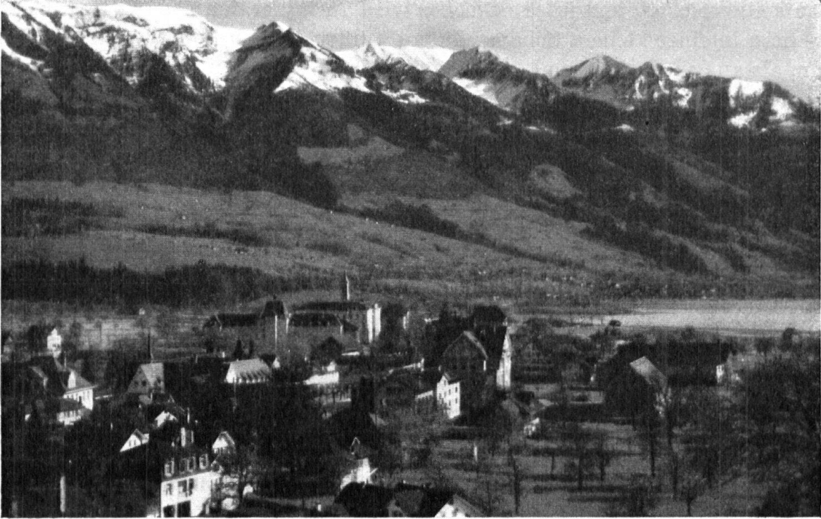
Sarnen gegen den See. — Le village de Sarnen avec son lac.

NACHDRUCK DER AUFSÄTZE UND MITTEILUNGEN BEI DEUTLICHER QUELLENANGABE ERWÜNSCHT