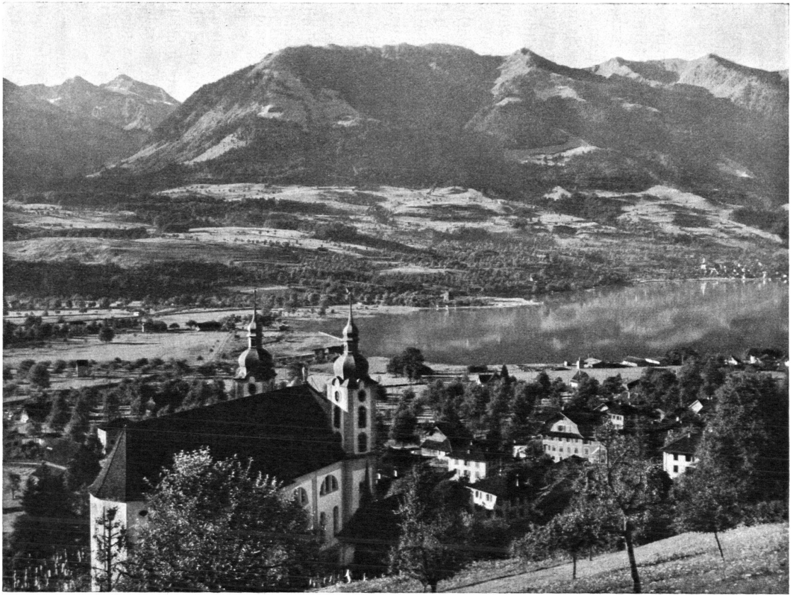
Kirche von Sarnen mit Blick auf den See — L'église de Sarnen, avec vue du lac.