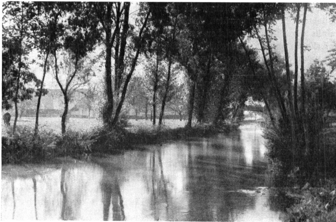
Die Aa mit dem Schwibogen. — La rivière Aa avec son pont en pierre.