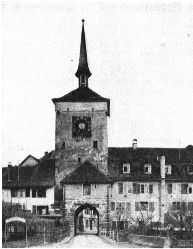
Porte Haute à Mellingen et son élargissement.