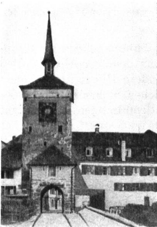
Erweiterung von aussen. Projet d'élargissement. Vue de l'extérieur.