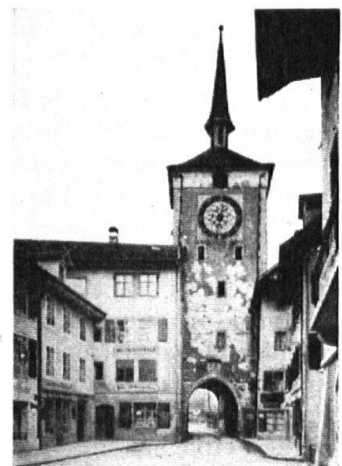
Alter Zustand, von innen. Etat actuel. Vue de l'intérieur.