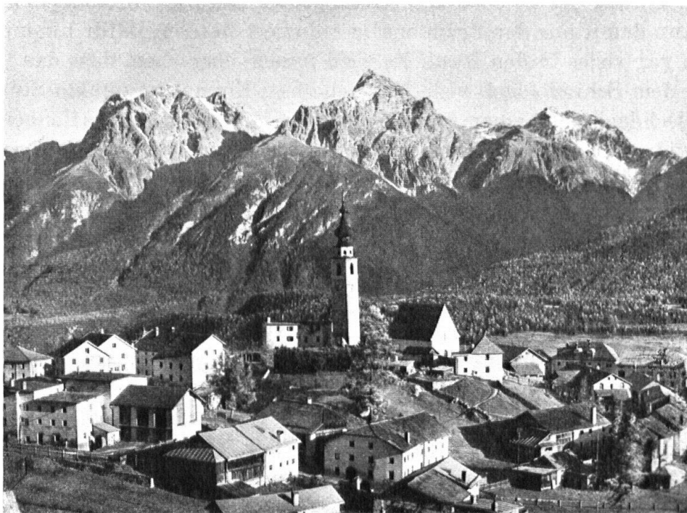
Zwei andere Beispiele aus Graubünden. Die Herrlichkeit der Bergwelt verdaut den fremdartigen Baustoff nicht. — Deux autres exemples des Grisons. La puissante nature des hautes montagnes digère, encore moins que la plaine, la matière incongrue de la tôle.