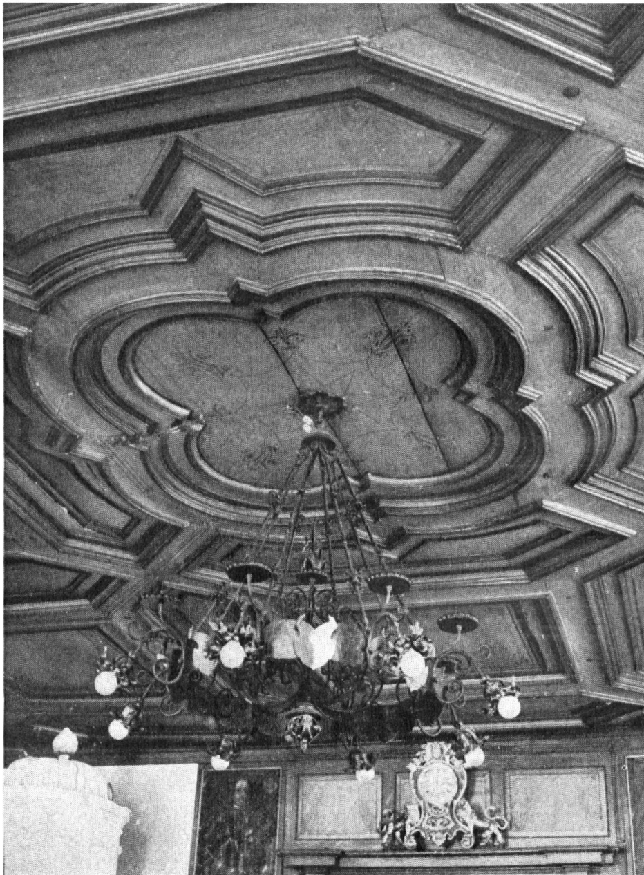
Kassettendecke des obern Rathssaales in Stans, die man wegen einer Vergrösserung des Saales entfernen möchte.

Der obere Saal, der Sitzungssaal für den Landrat und die Gerichte, wurde in Holz getäfert und erhielt eine schöne Kassettendecke aus harthölzernem Rahmenwerk mit tannenen Füllungen. (Also nicht wie behauptet worden: Eine zerrissene tannene Decke!) Die Wände nehmen die Bildnisse der alten Landammänner ein. Das Prunkstück des Saales ist ein prachtvoller Ofen mit Bildern aus der Tellgeschichte und der Signatur: Michael Leonty Küöchler, Hafner in Muri 1770. Der