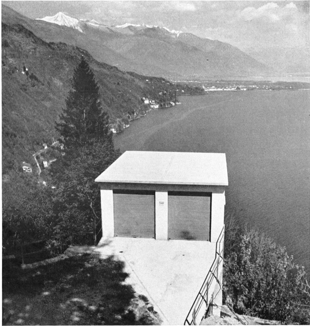
Ein Verbrechen: der heutige Blick vom Kirchplatz Ronco gegen Ascona. (Wiedergabe behördlich bewilligt am 27. 6. 1940 gemäß BRB vom 3. 10. 1939.) — Le paysage, tel qu'on le voit désormais.

Und nun das Verbrechen! Ausgerechnet an den Fuß dieser Kirchenterrasse hat ein von Gott und allen guten Geistern verlassener Taxichauffeur auf hohen Stelzen eine Garage in die freie Luft hinaus gebaut, einen Betonkasten übelster Art, der die ganze Aussicht seeaufwärts in unerträglicher Weise verdirbt. Der Verstand steht einem still, wenn man dieser Untat inne wird.