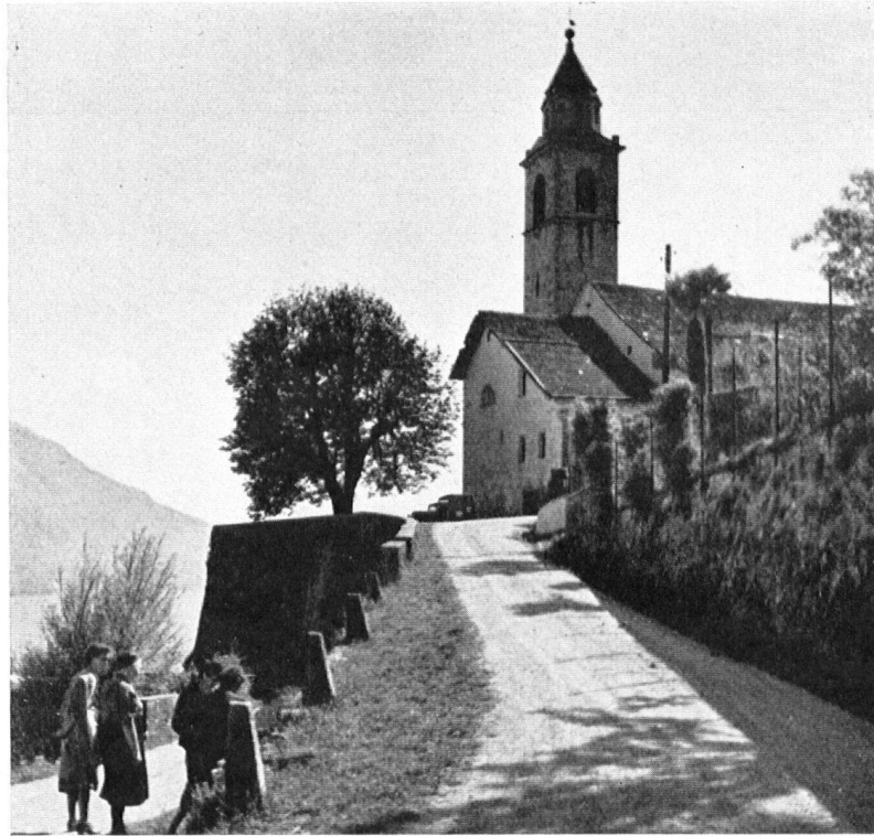
Die Kirche in Ronco (Tessin). Bis vor kurzem einer der schönsten Orte am schweizerischen Langensee.

L'église de Ronco, naguère un des plus beaux points de vue du Lac Majeur.