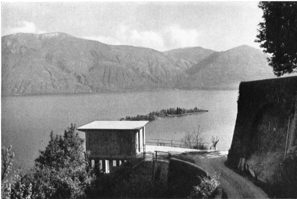
Die neue Taxi-Garage auf Betonpfeilern. — Le garage que l'on vient d'édifier à sa base.

Unsere ennetbirgischen Freunde werden es uns bestimmt nicht übel nehmen, wenn wir sie hier auf einen Fall hinweisen, an dem sie ein erstes Exempel statuieren sollten. Wer kennt nicht die Kirche von Ronco am Langensee mit ihrer baumbestandenen alten Terrasse ? Der Blick, den man dort genießt, ist einzigartig. Weit und blau liegt der See zu Füßen des Beschauers. Gegen Mittag sieht man zwischen den grünen Bergen nach Italien hinunter; im Norden grüßt der blühende Uferseum von Ascona. Wie ferne Schafherden stehen die Dörfer ringsum an den Berghängen, und auf dem See schwimmen, Spielzeugen gleich, die Inseln von Brissago. Wir sagen nicht zuviel, wenn wir den Kirchplatz von Ronco und seine Aussicht zu den klassischen Schönheiten der italienischen Schweiz zählen.