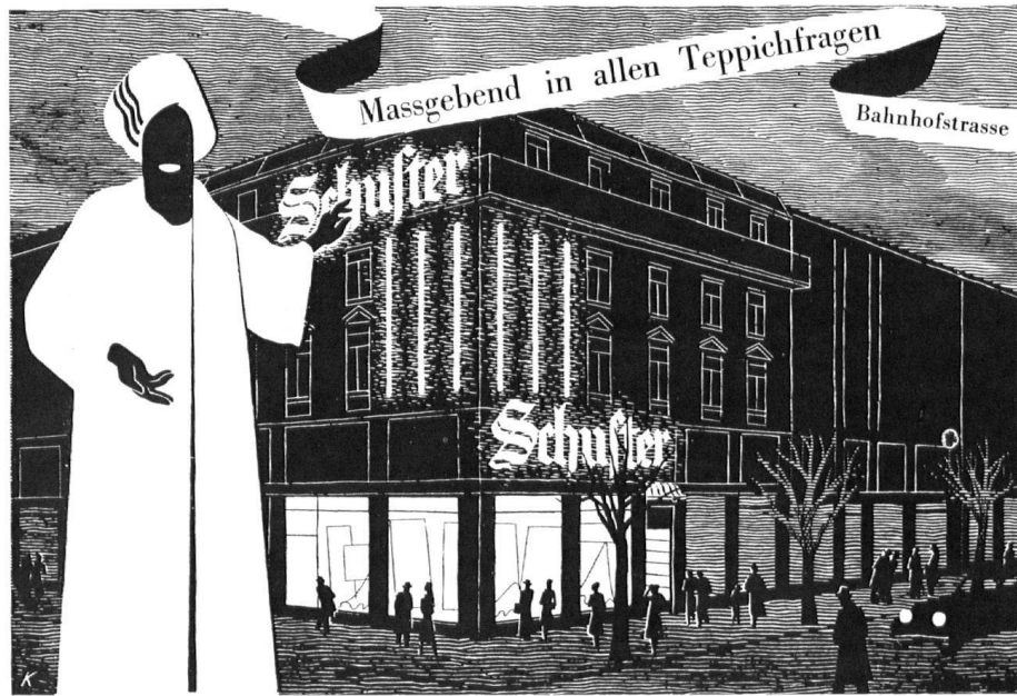
Schuster & Co., Bahnhofstraße 18, Zürich — Gleiches Haus in St. Gallen