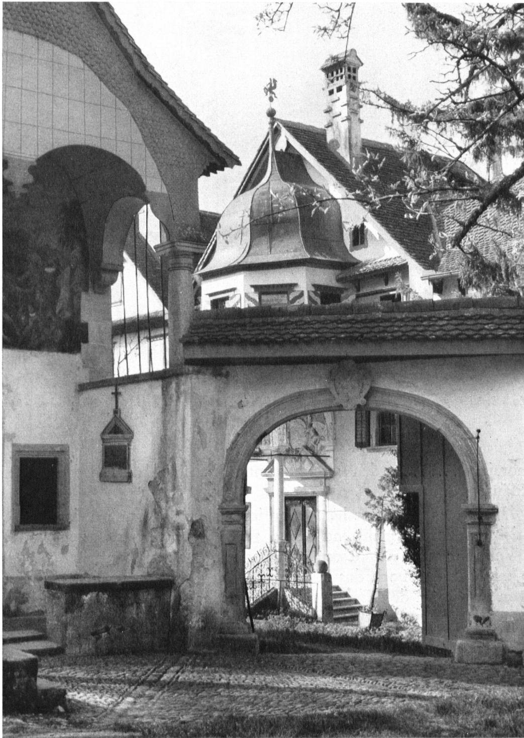
Der Herrnsitz zum „Immißfeld“. Blick in den Hof mit dem prunkvollen Eingang. Links die Hauskapelle St. Antonius von 1687.

« Immenfeld », demeure patricienne près de Schwyz. A gauche la chapelle de St-Antoine (1687).