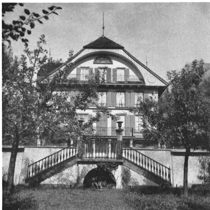
Der Auf der Maur'sche Familiensitz zum „Brüel“, erbaut um 1680, erneuert um 1830.

Le « Brüel », propriété ancestrale des Auf der Maur, fut construit en 1680, transformé en 1830.