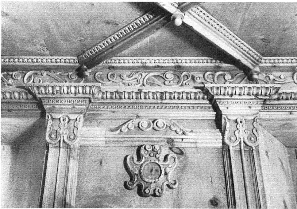
Einzelheit des Getäfers der Stube aus Sent, jetzt im Plantahauss Samedan.

Ces communes se nomment Sent et Samedan ou, ainsi que nous disions naguère, à l'allemande, Samaden. En somme deux chefs-lieux. Le premier l'emportait autrefois sur tous les bourgs de l'Engadine, et se contente aujourd'hui de sa prééminence sur le pays inférieur, alors que Samedan règne sur le haut pays.