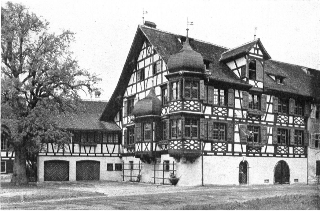
Die erneuerte «Drachenburg» in Gottlieben, eine der schönsten Riegelbauten des Kantons Thurgau.

La «Drachenburg» de Gottlieben est une des plus belles maisons à colombages de toute la Thurgovie.