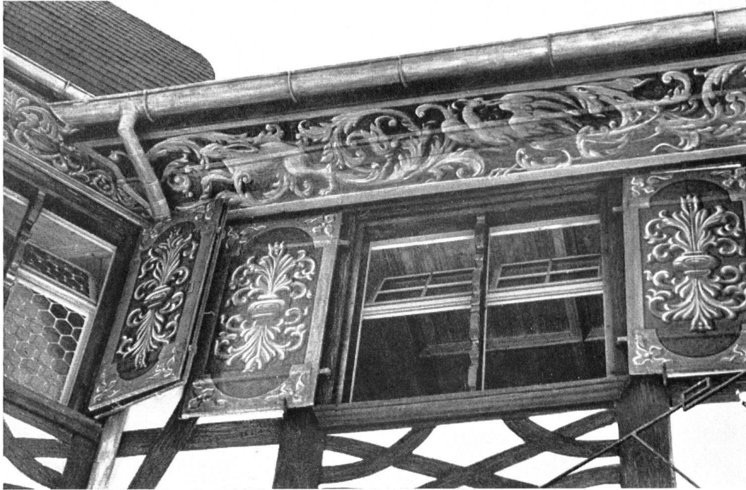
Die renovierten Malereien am Dachgesimse. Les peintures à la détrempe des volets et de l'avant-toit.

Das Innere verrät in seiner Raumeinteilung den selbstbewußten bürgerlichen Bau- stolz des 17. Jahrhunderts. Vom geräumigen Hausflur mit einer leichten Eichensäule führt eine Balustertreppe zum oberen Vorraum und von diesem in die wohlpropor- tionierten Erkerstuben und übrigen Räume, die freilich, mit Ausnahme eines nach hinten liegenden kleinen Saales wenig mehr an Getäfel oder Decken aufweisen . . .»