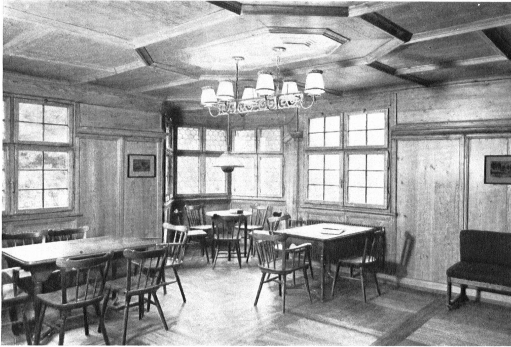
Die «Drachenburg» in Gottlieben. Weinstube im 2. Stock.