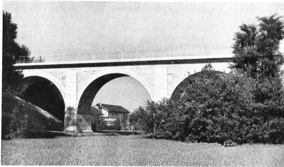
Le pont de l'Oens, construit en 1857, près de Wanzwil (Berne), est heureusement supporté aujourd'hui par trois arches élégantes.